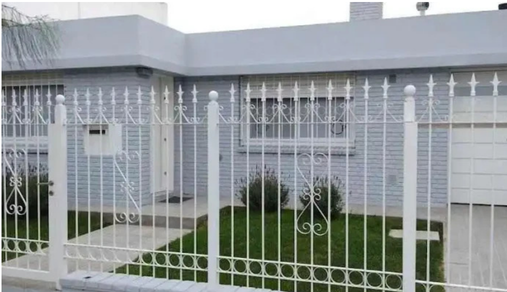
Centro prendario s a s cordoba