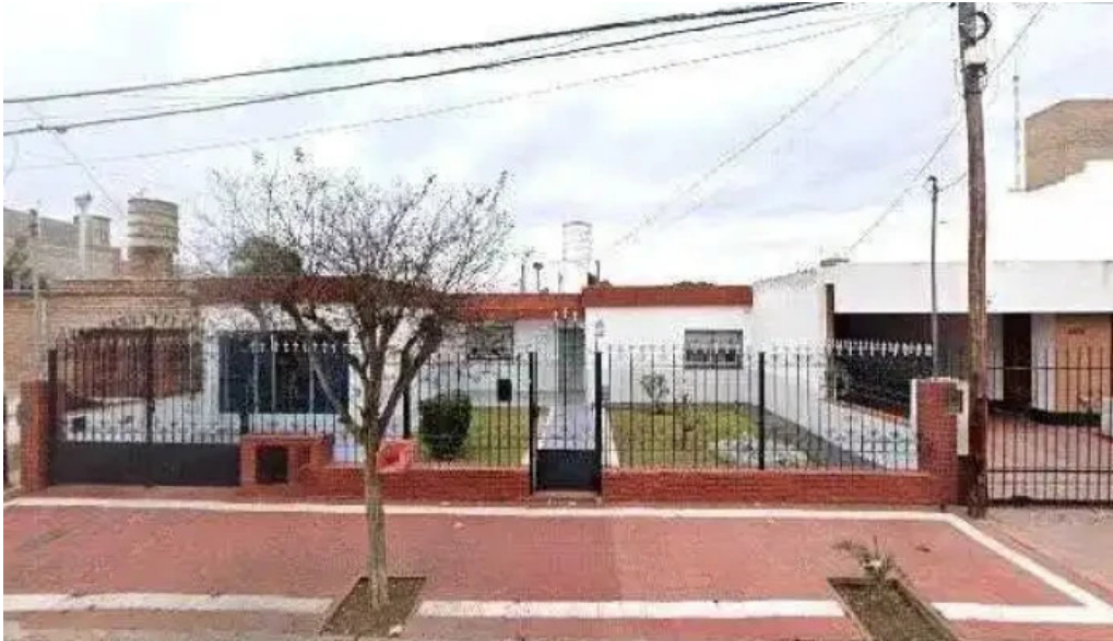
Centro prendario sas opiniones