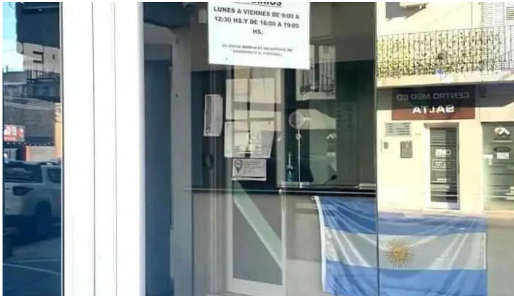
Libermar multifiananzas sa del propietario