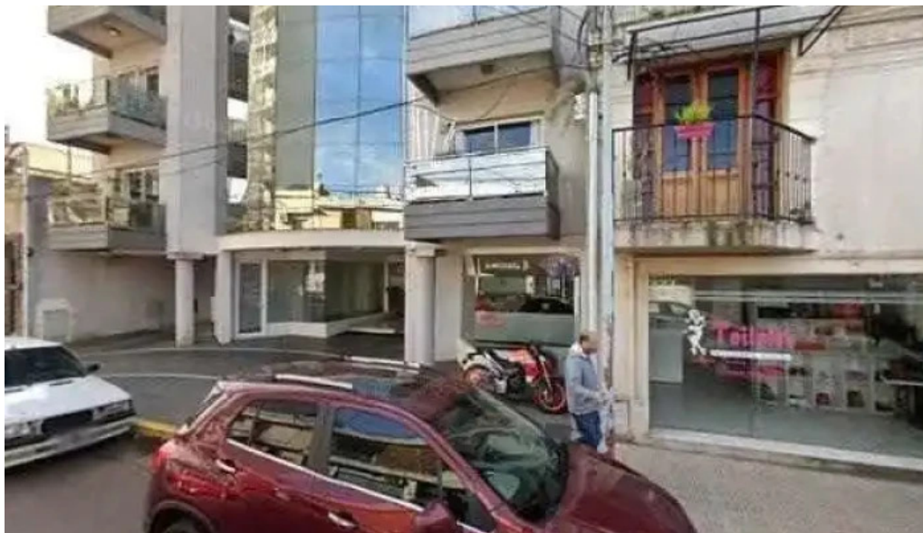
Libermar multifiananzas sa como llegar