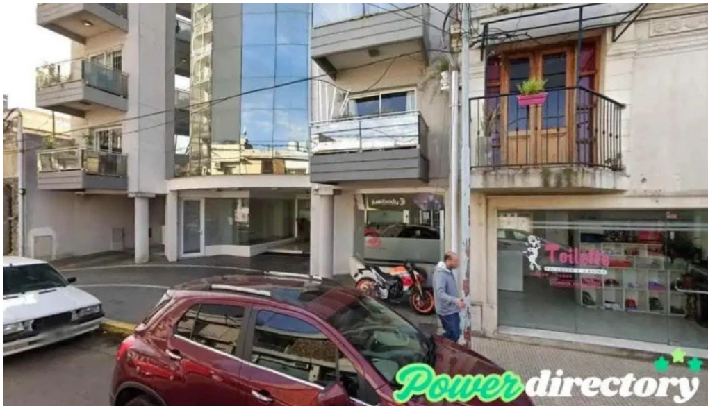
Libermar multifinanzas s a concordia