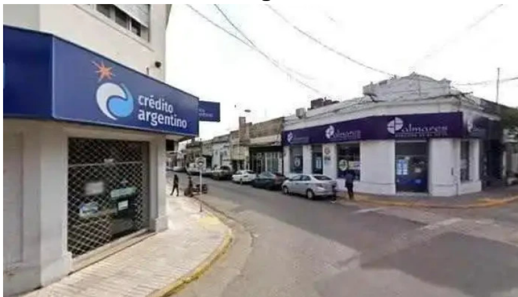
Credito argentino numero