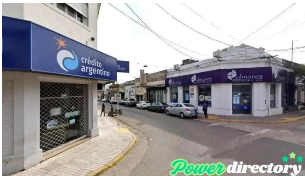
Credito argentino concordia