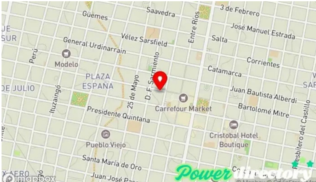
Credil prestamos en efectivo mapa