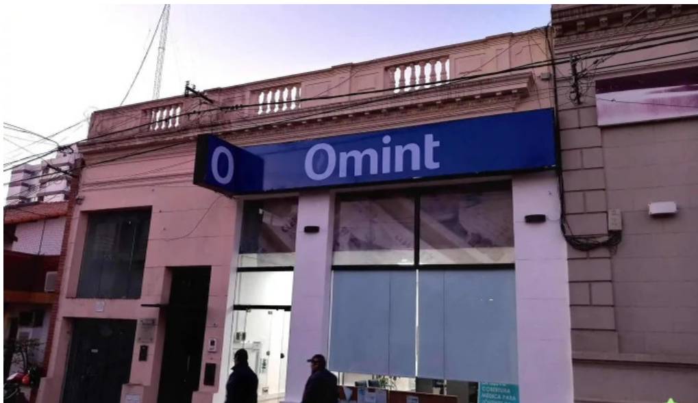
Credil prestamos en efectivo exterior