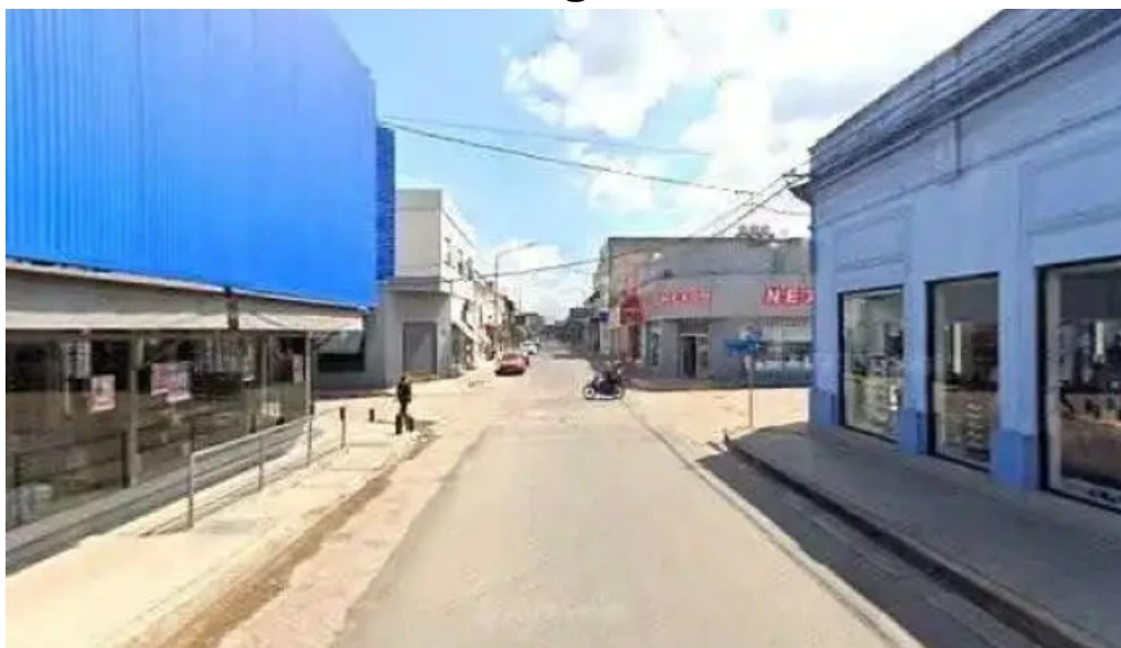
Credito argentino opiniones