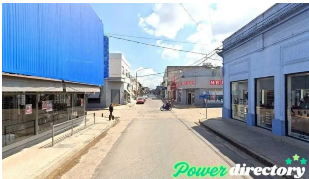
Credito argentino concepcion del uruguay