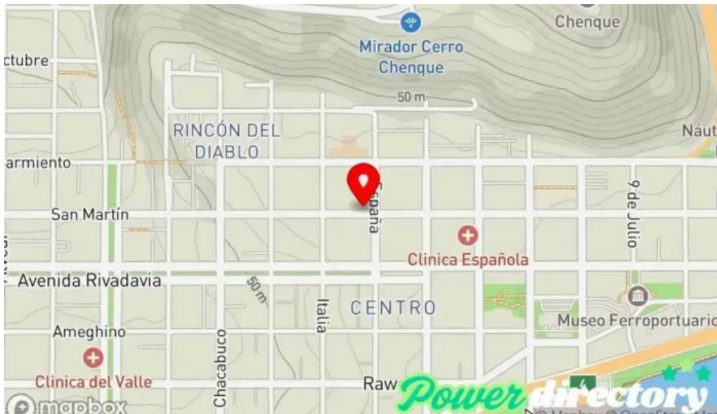
Credil prestamos en efectivo mapa