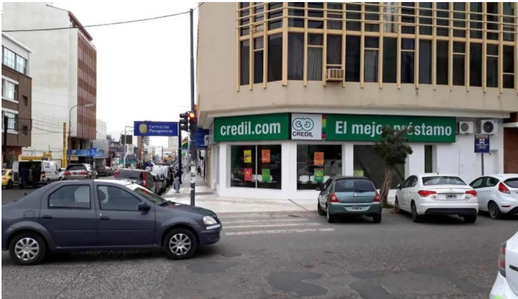
Credil prestamos en efectivo telefono