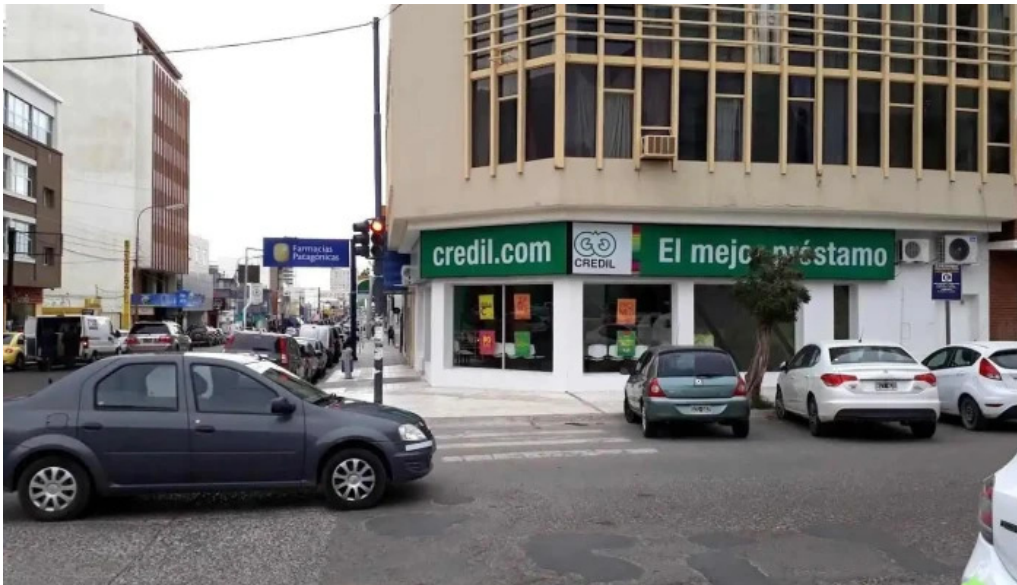
Credil prestamos en efectivo comodo rivadavia