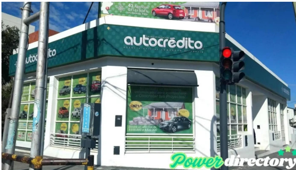
Autocredito agencia oficial comodoro rivadavia exterior