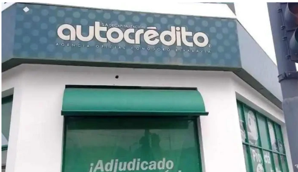
Autocredito agencia oficial comodoro rivadavia comodoro rivadavia