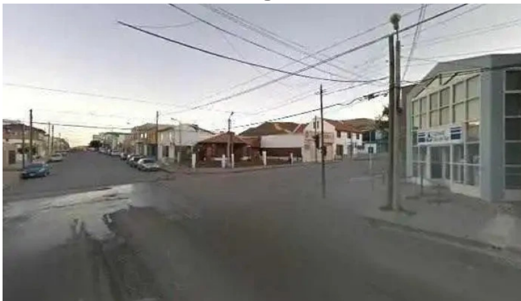
Autocredito agencia oficial comodoro rivadavia preciosdeg