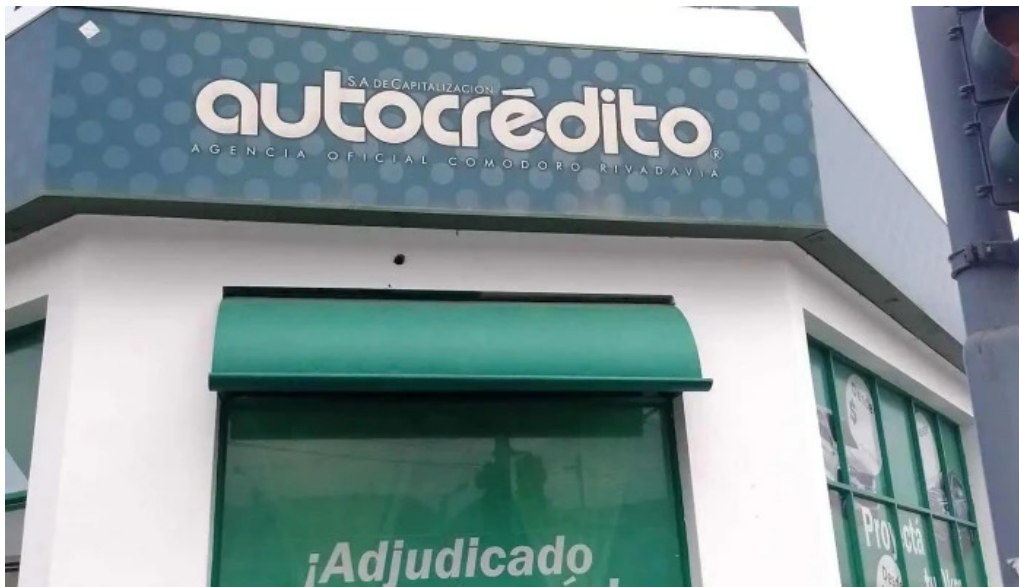
Autocredito agencia oficial comodoro rivadavia precios