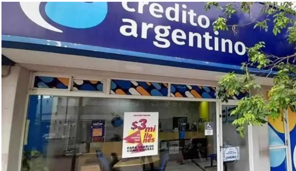
Credito argentino colon