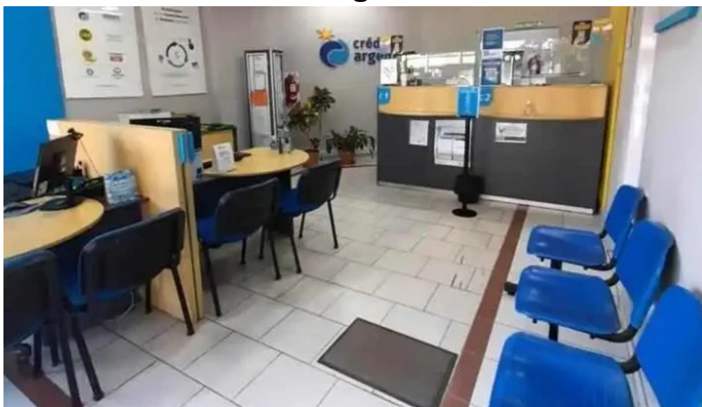
Credito argentino mas recientes