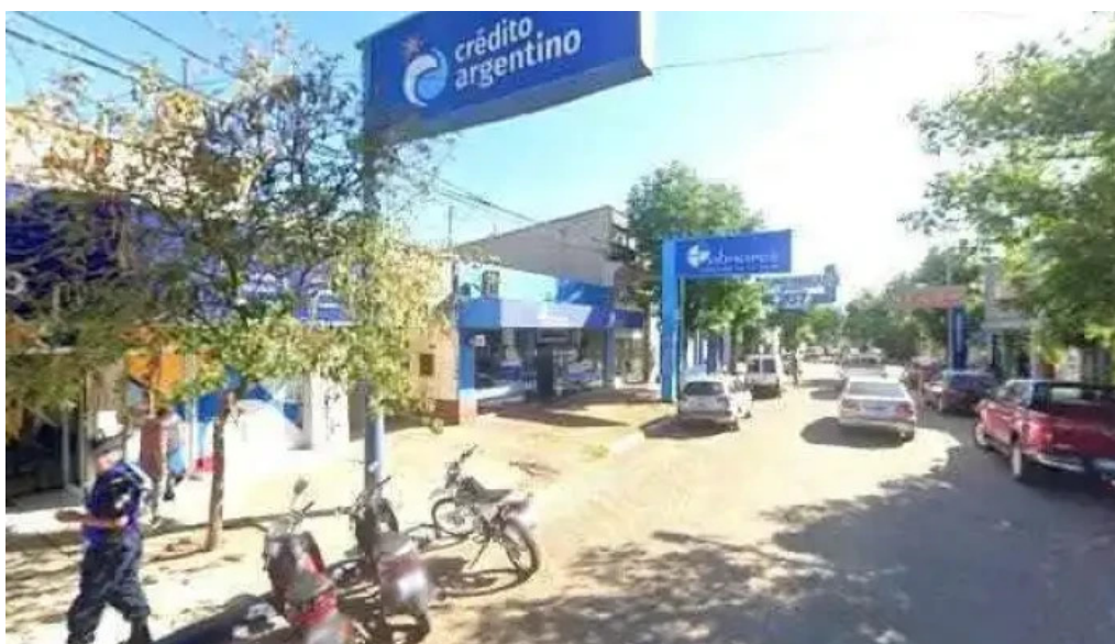
Credito argentino cerca de mideg