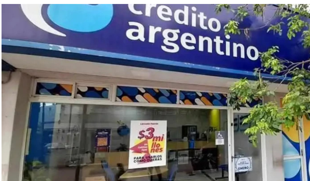
Credito argentino cerca de mi