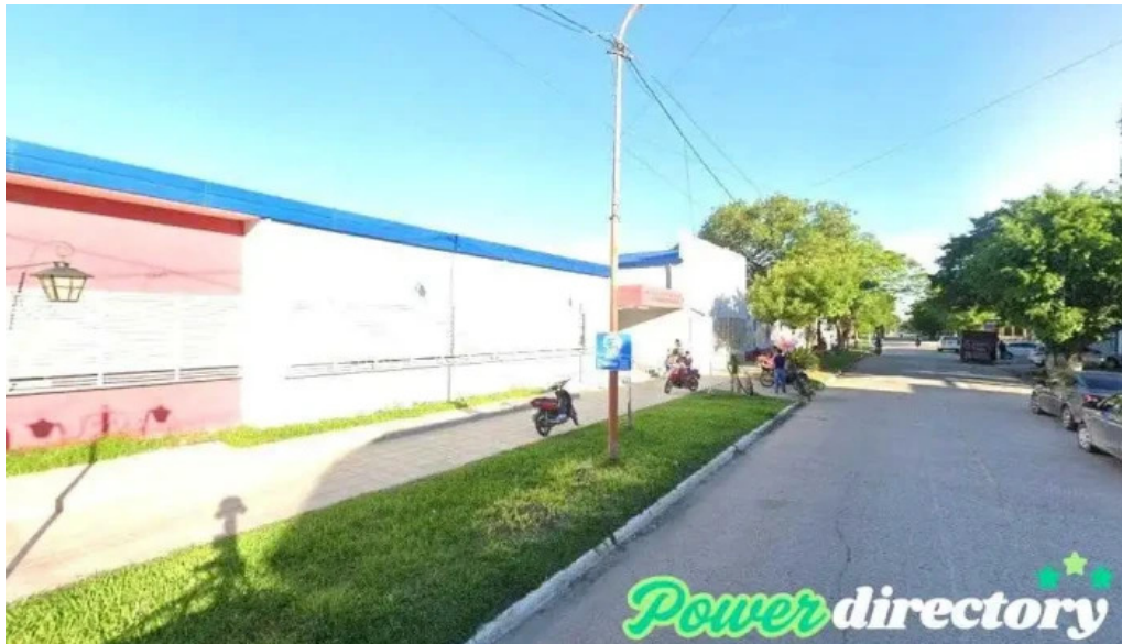
Profit credits e inversiones clorinda