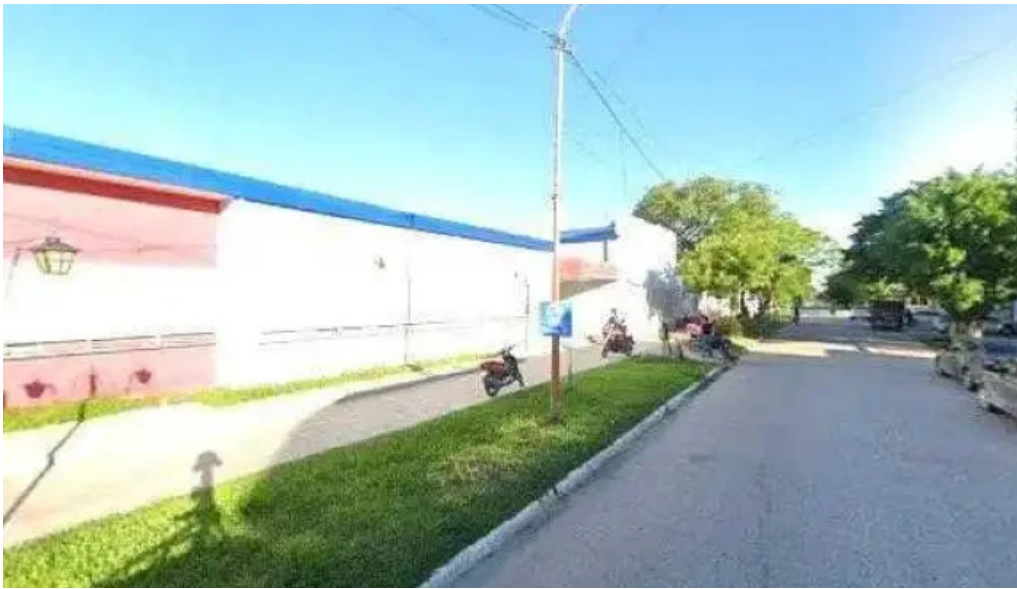
Profit credits e inversiones ubicacion