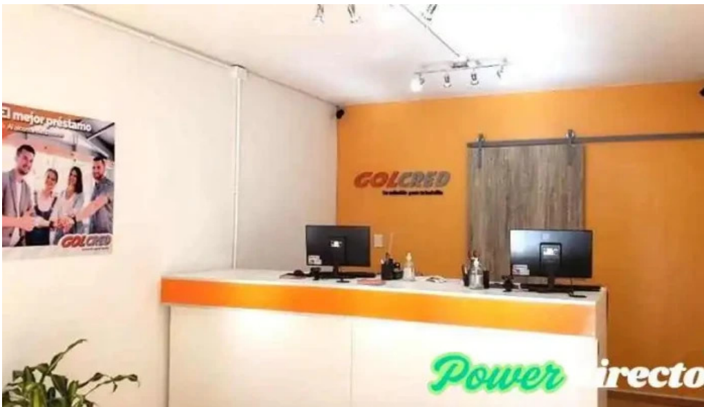
Golcred como llegar