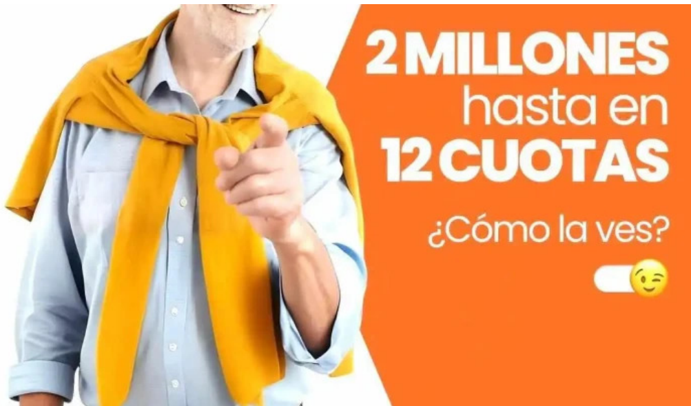
Golcred del propietario