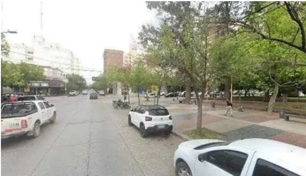
Golcred como llegardeg