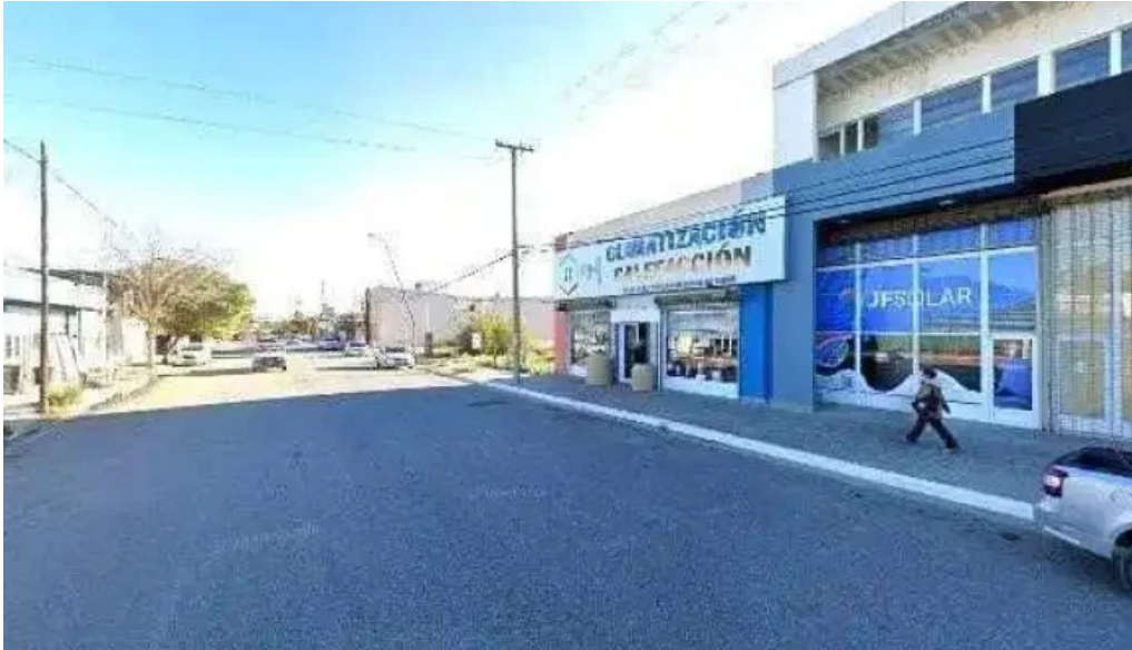
Tarjeta huilen cerca de mi