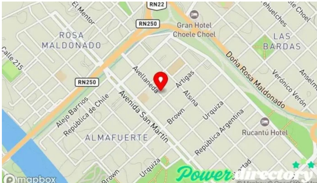
Tarjeta huilen mapa