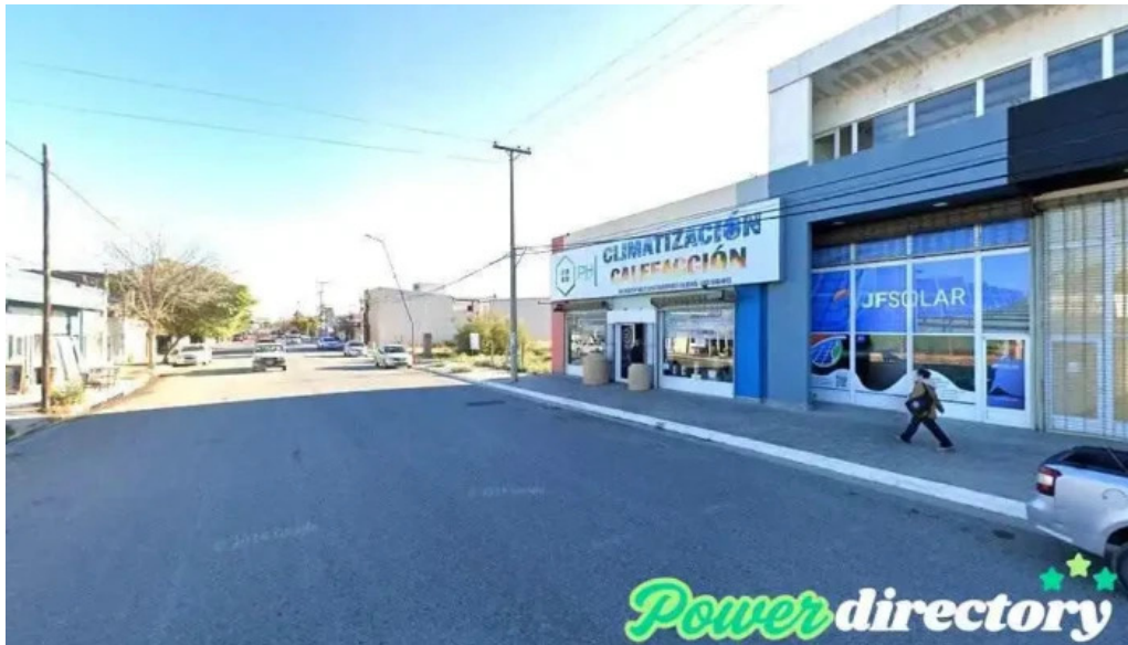
Tarjeta huilen choele choel