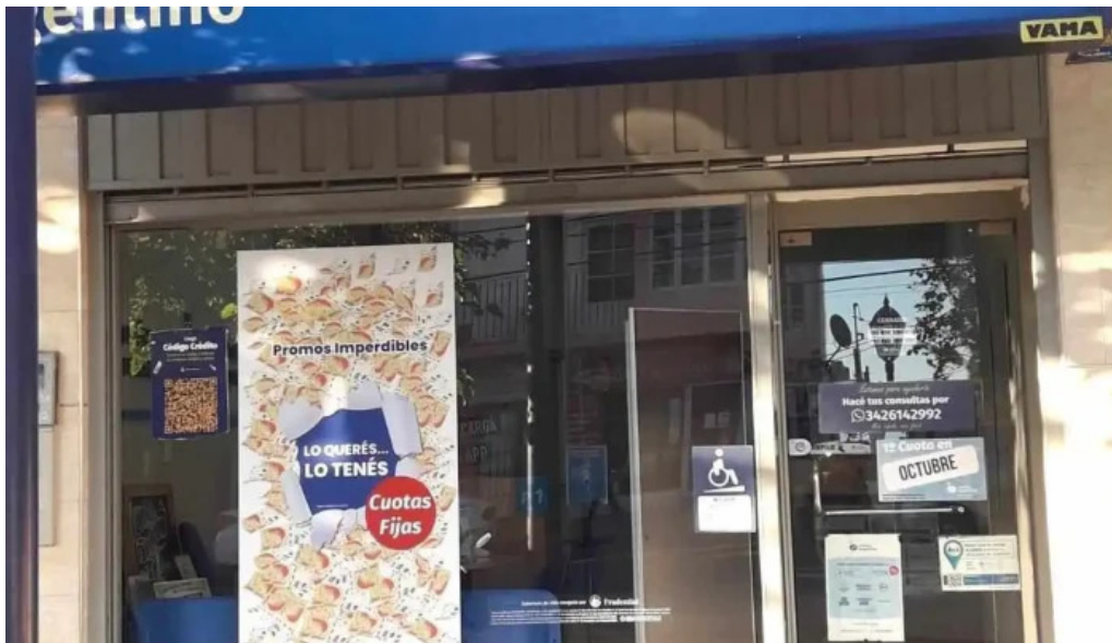
Credito argentino numero