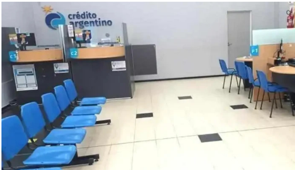
Credito argentino mas recientes