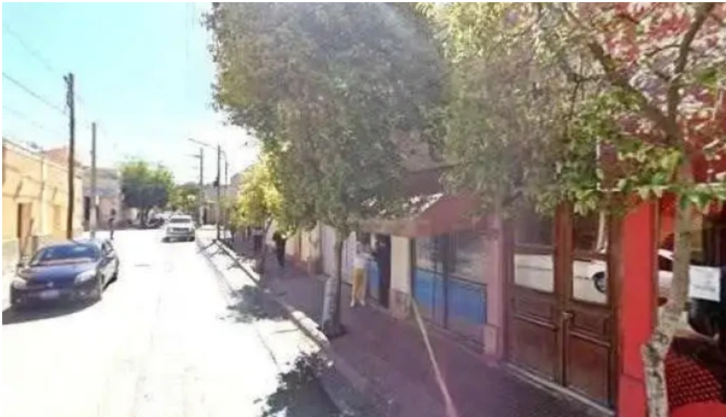
Credito argentino numerodeg