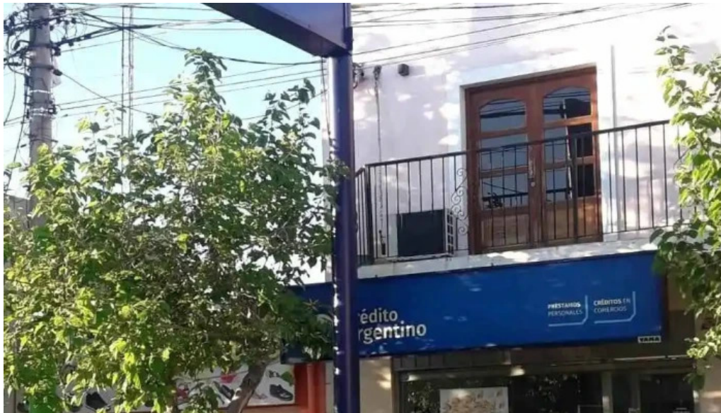
Credito argentino del propietario