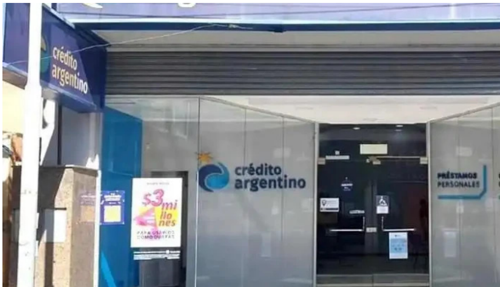
Credito argentino exterior