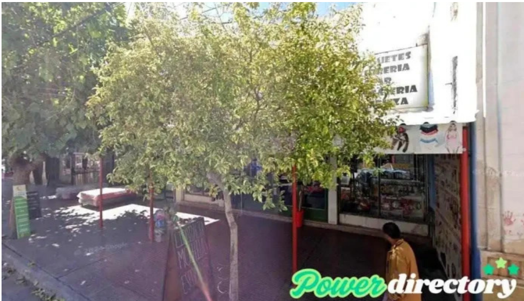
Credil prestamos en efectivo chilecito