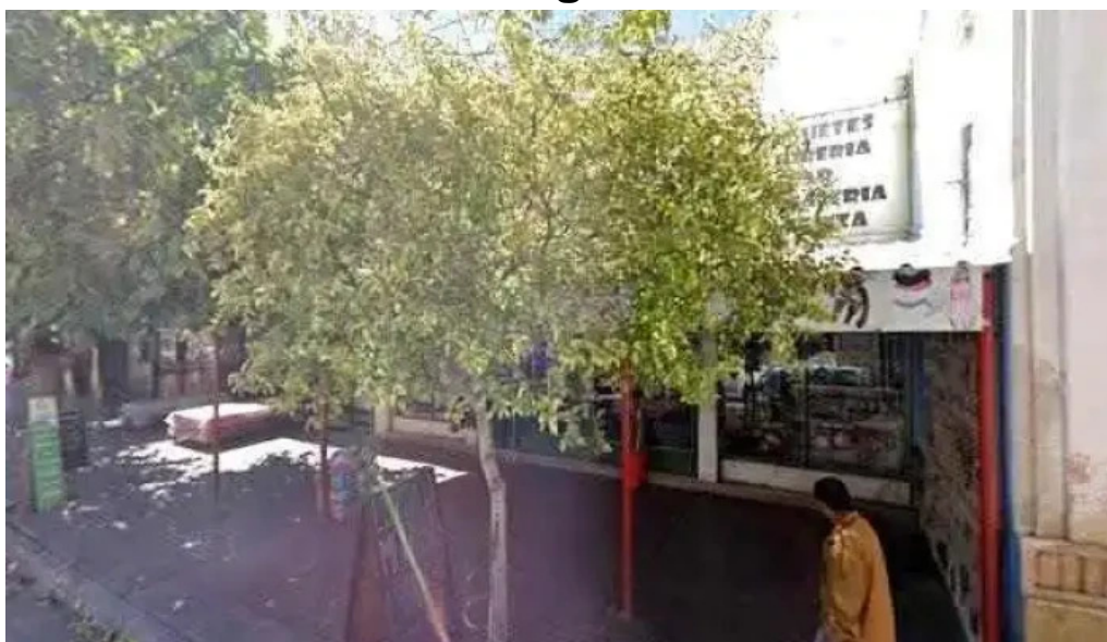
Credil prestamos en efectivo numero