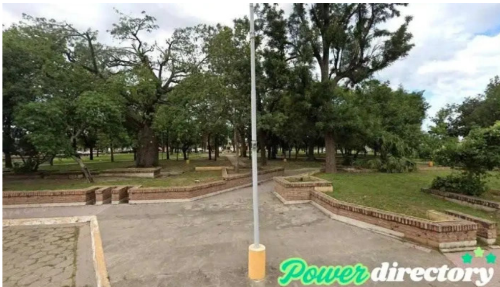
Mutual u c y d filial ceres ceres