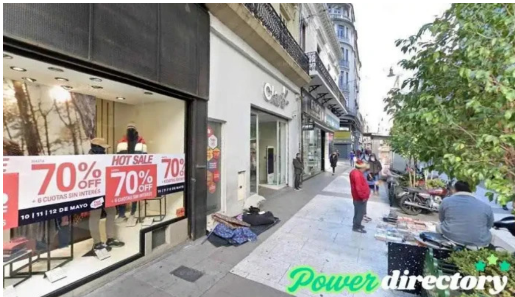
Prestamo automatico cdad autonoma de buenos aires