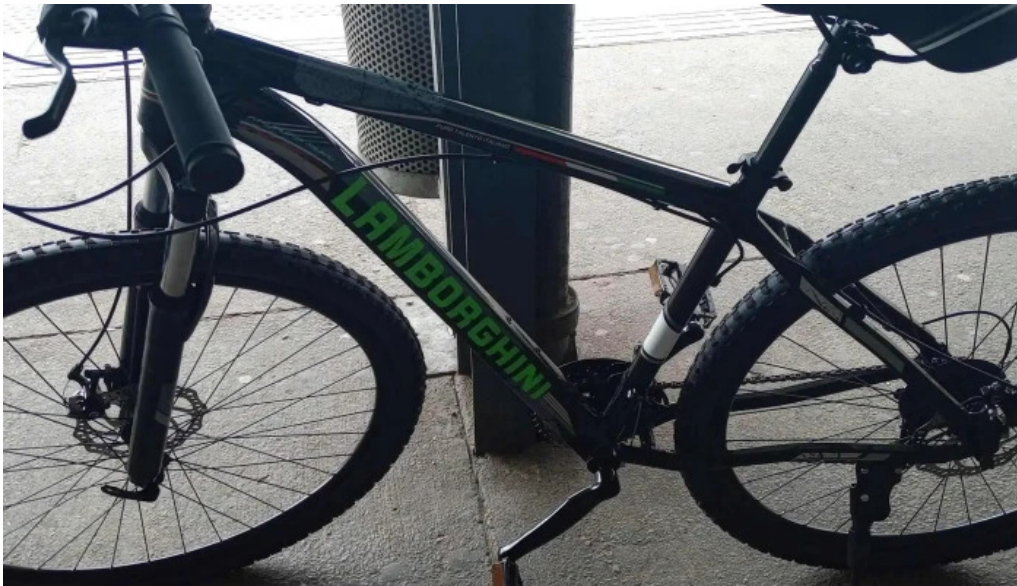
Pareto prestamos videos