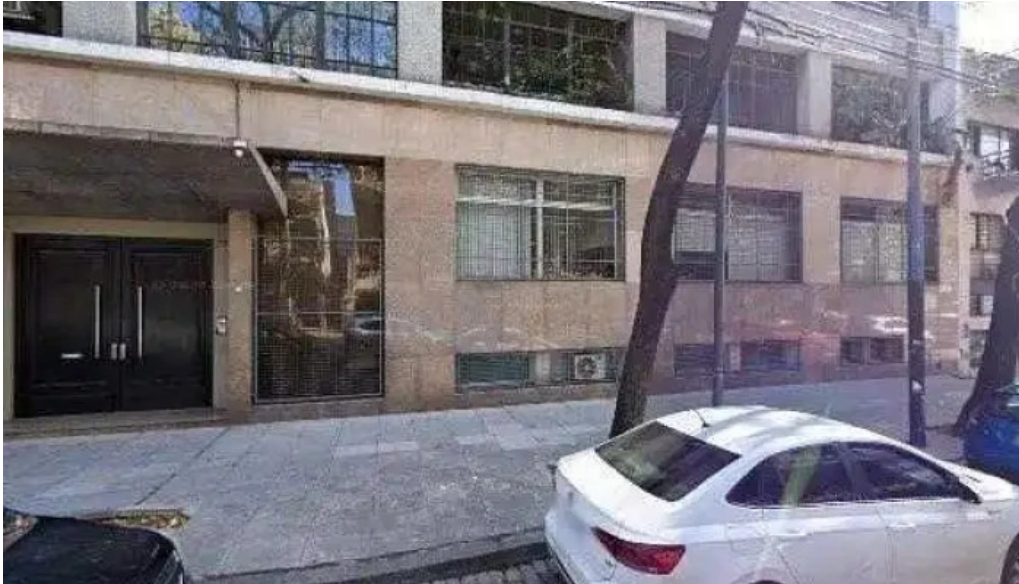
Creditam sa promocion