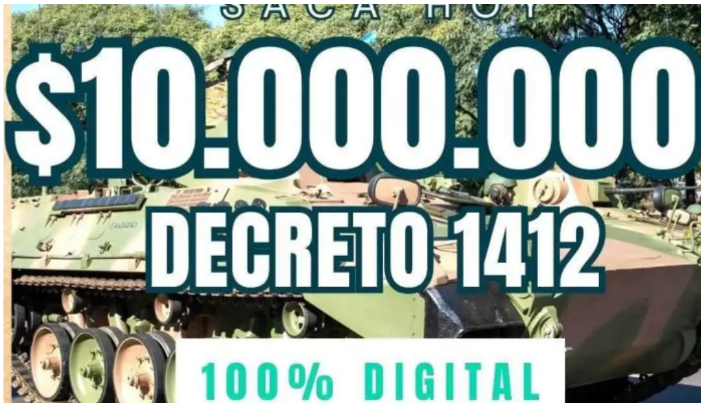
Credifuerza prestamos del propietario