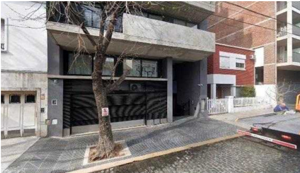
Credifuerza prestamos cerca de mideg