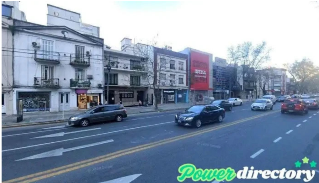
Chequeshoy cdad autonoma de buenos aires