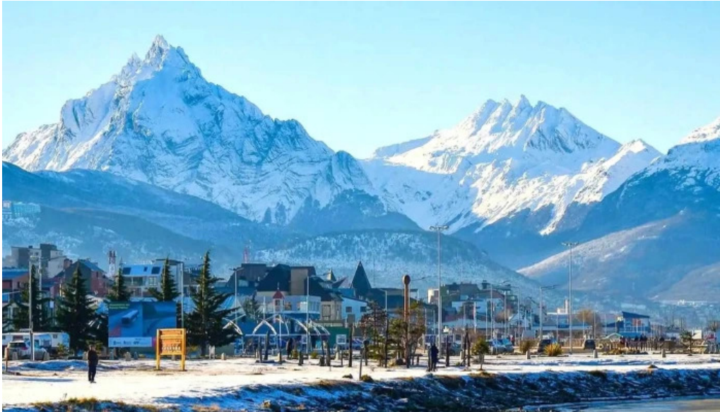
Cerrocred cdad autonoma de buenos aires