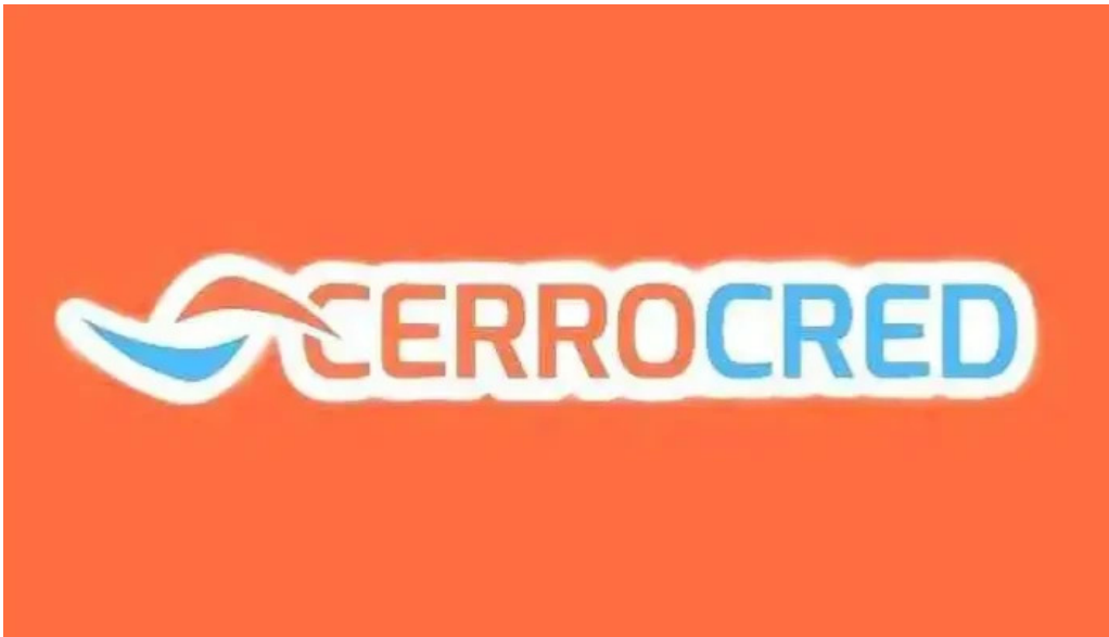
Cerrocared del propietario