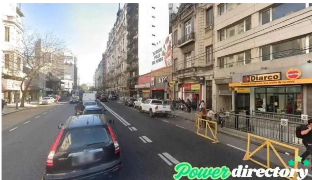
Cartasur once cdad autonoma de buenos aires