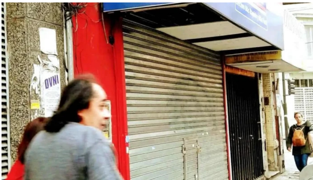
Cartasur once exterior