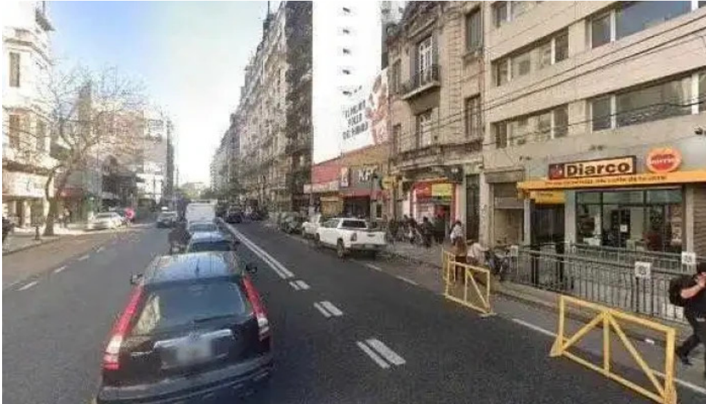
Cartasur once telefono