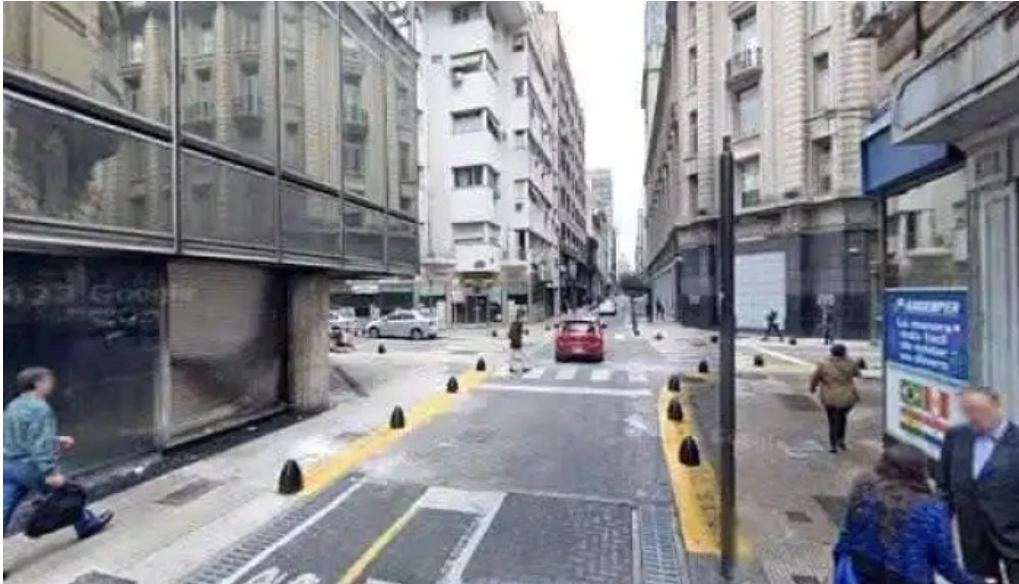
Argentina credits abierto ahora