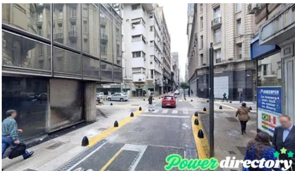
Argentina credits cdad autonoma de buenos aires