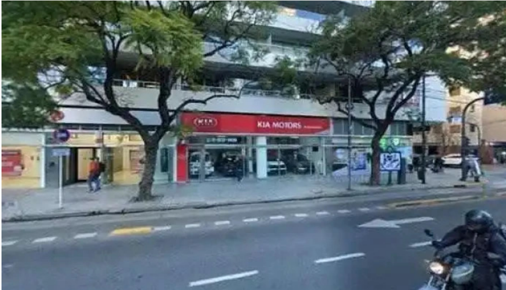
Agl capital sa videos