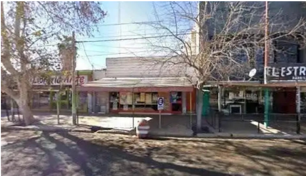
Credito argentino sitio webdeg