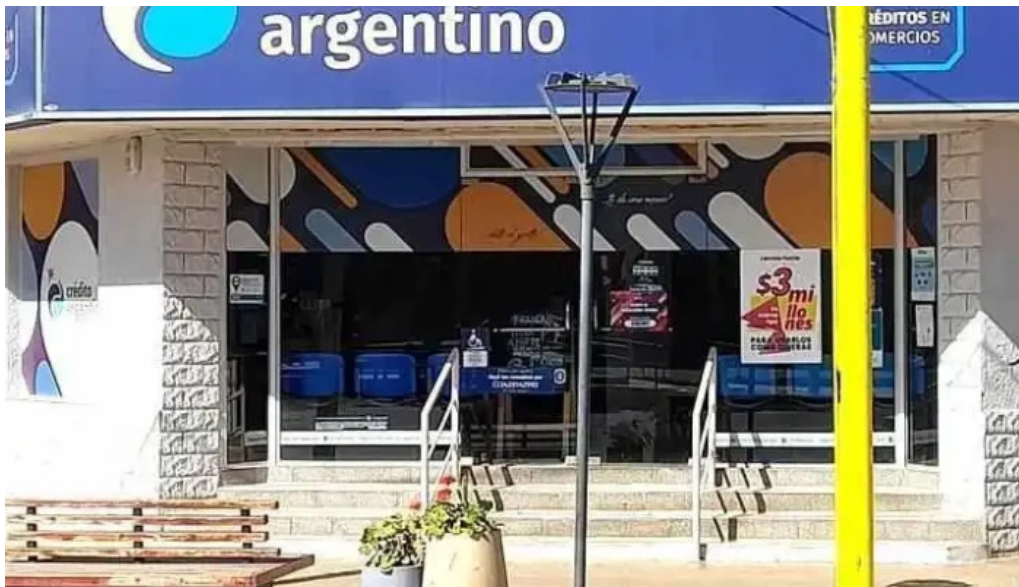
Credito argentino sitio web