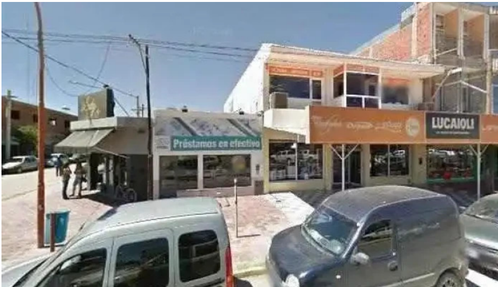
Credil prestamos en efectivo videos