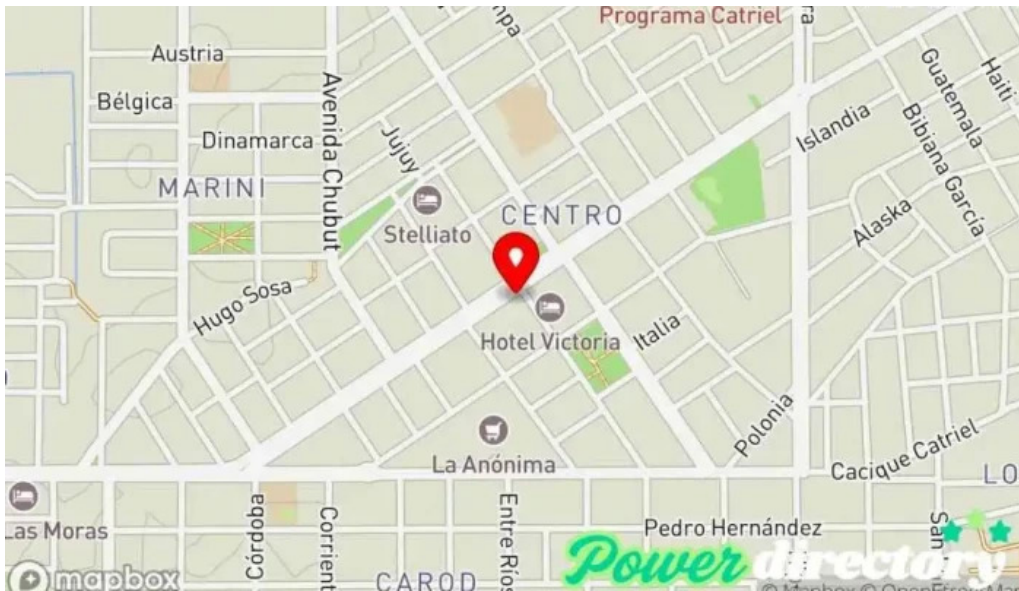
Credil prestamos en efectivo mapa