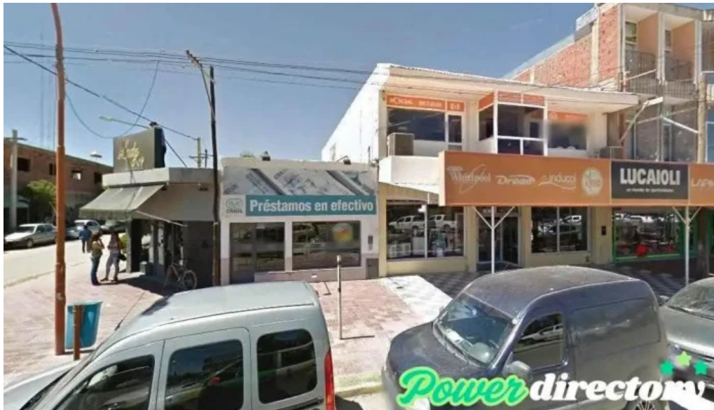
Credil prestamos en efectivo catriel