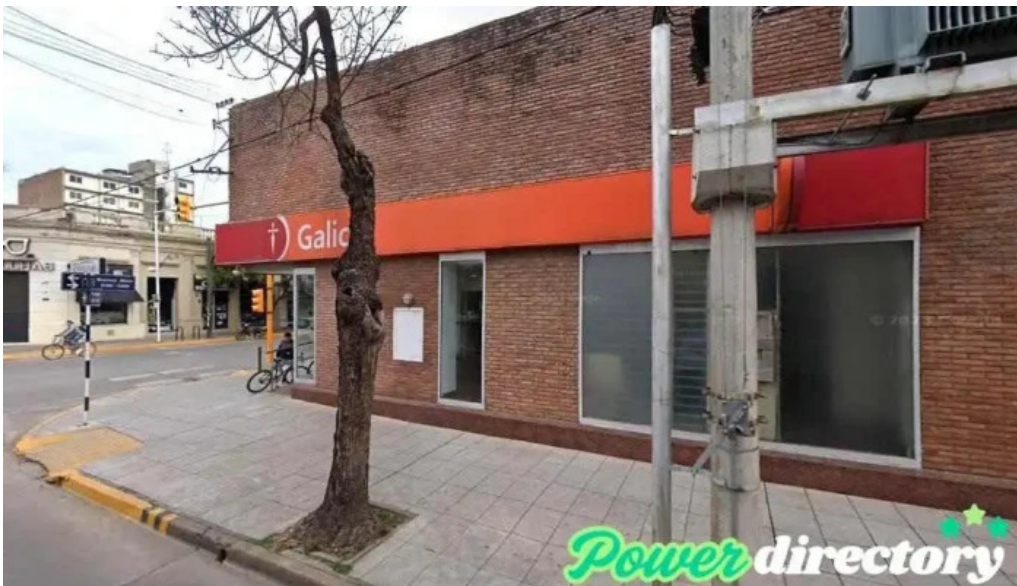
Credito argentino casilda