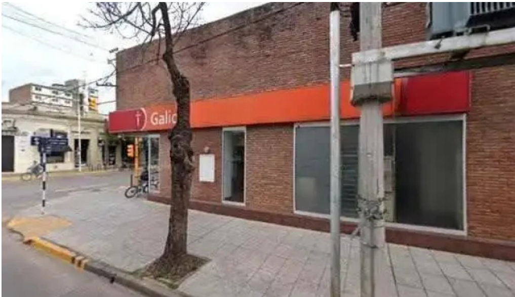
Credito argentino catalogo