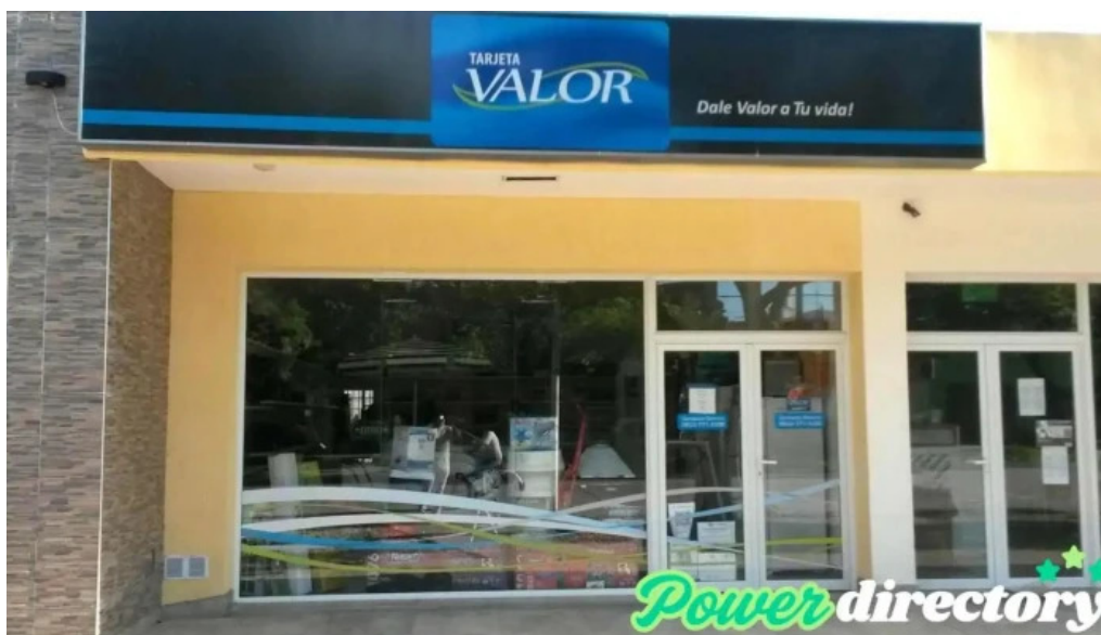
Tarjeta valor carcarana