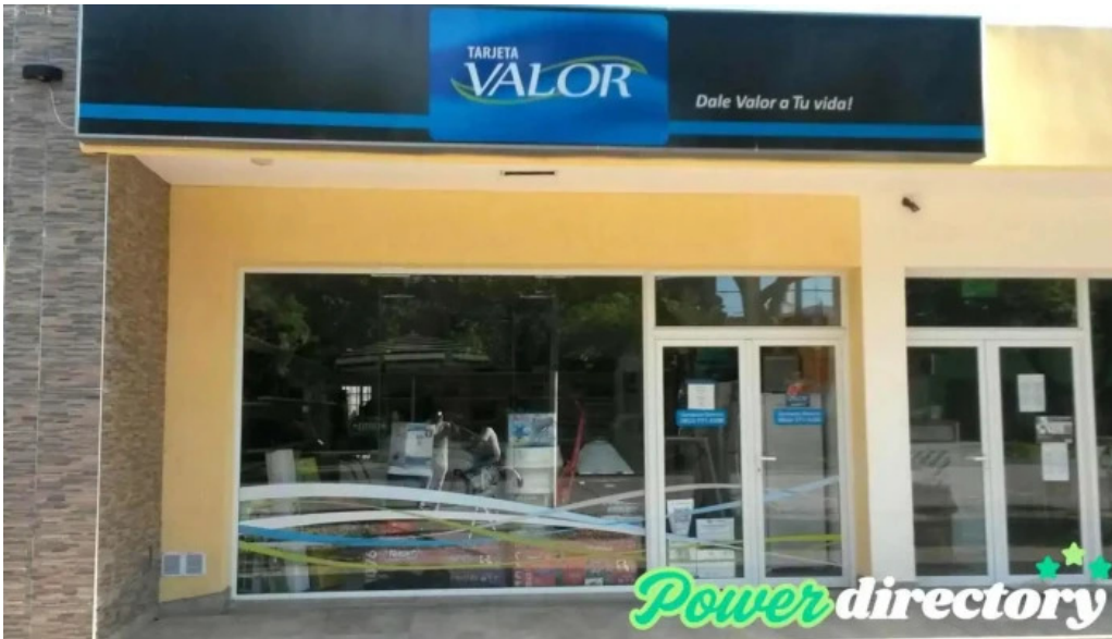
Tarjeta valor fotos