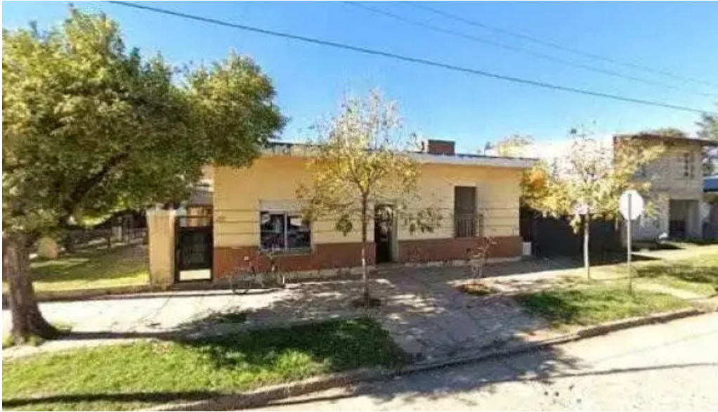
Tarjeta valor fotosdeg