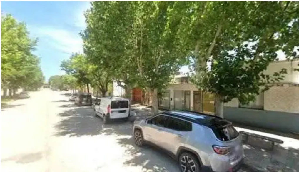
Mutual de socios del afc ubicaciondeg