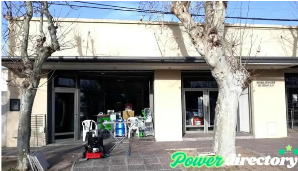
Mutual de socios del AFC ubicación