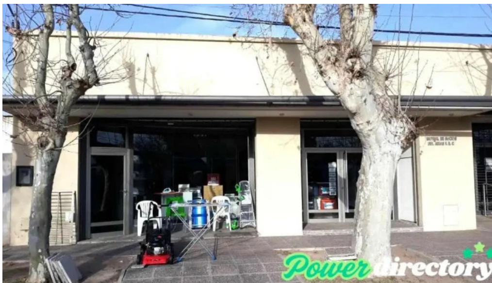
Mutual de socios del a f c canals