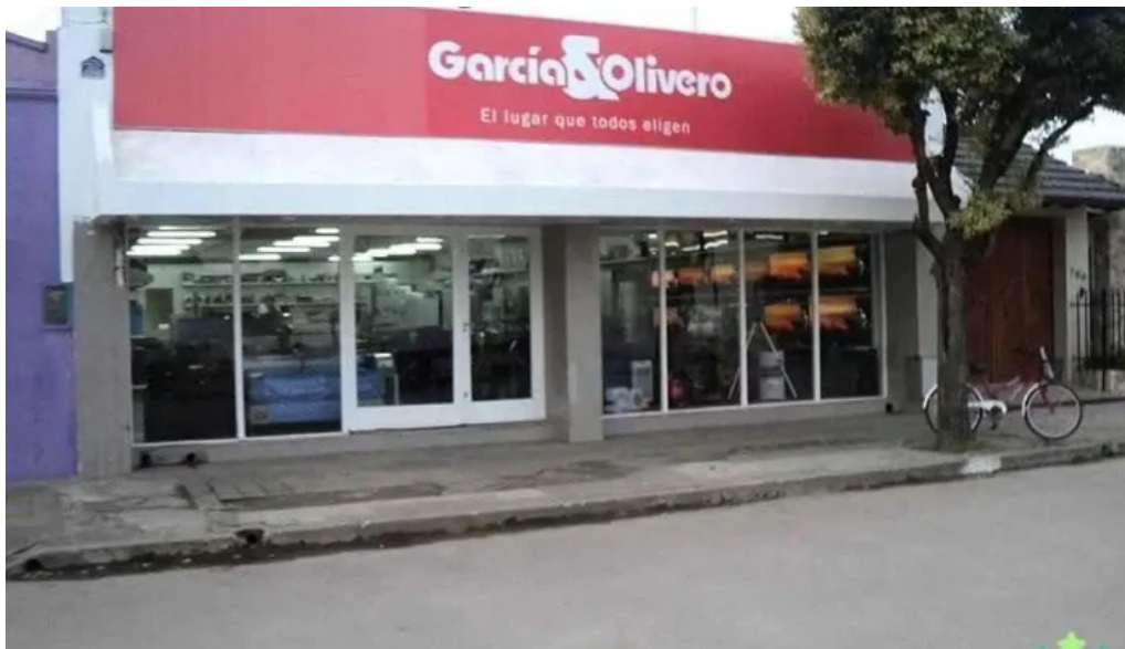
Tarjeta valor camilo aldao