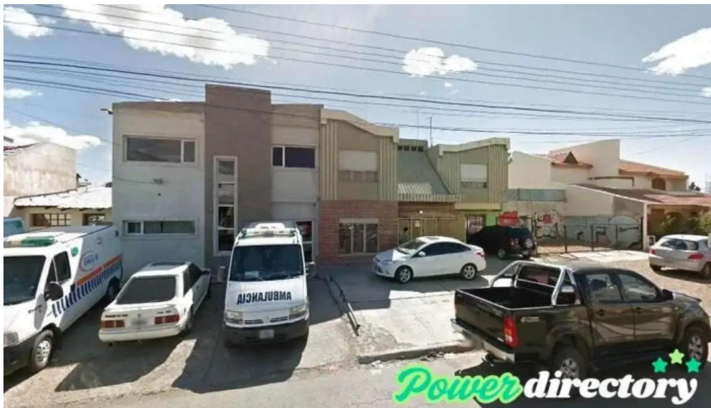
Credil prestamos en efectivo caleta olivia