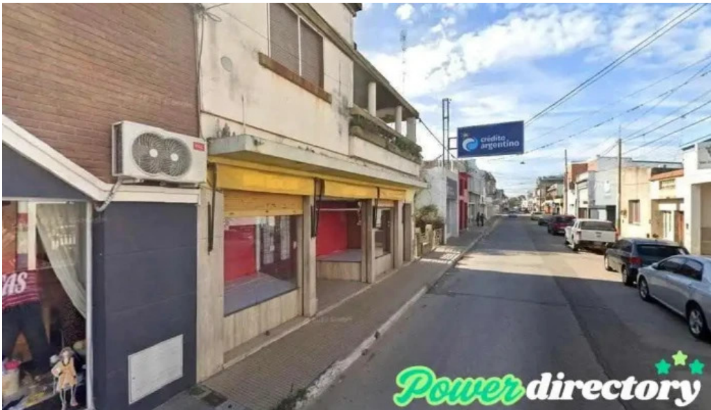
Credito argentino bzj