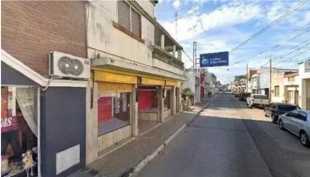
Credito argentino cerca de mi