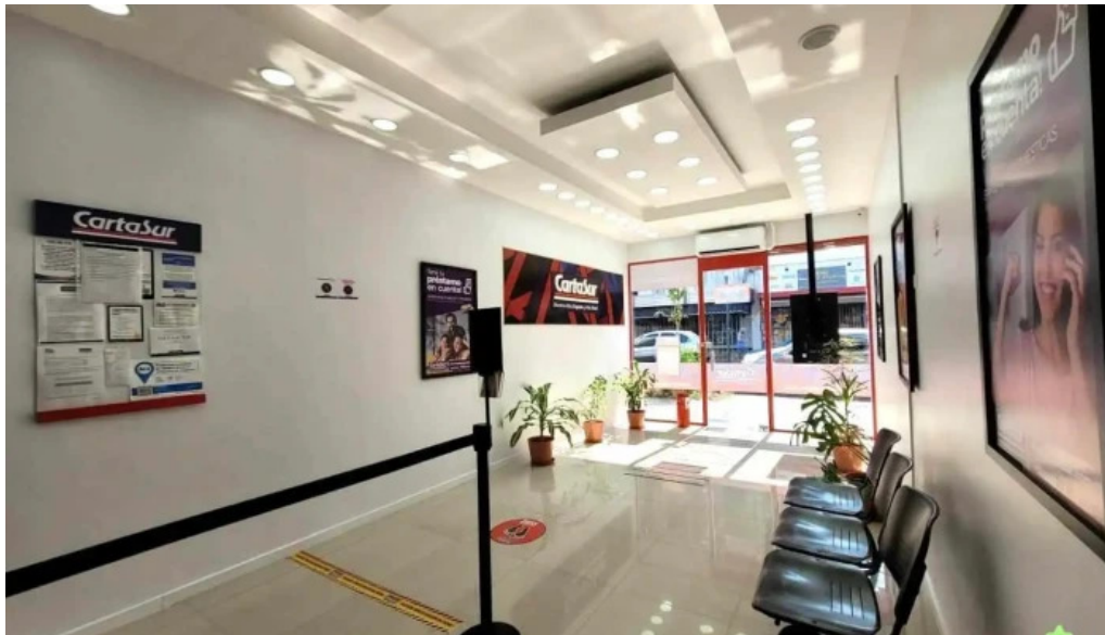
Cartasur buenos aires