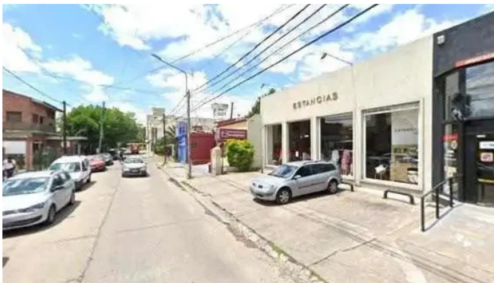
Cpe creditos donde