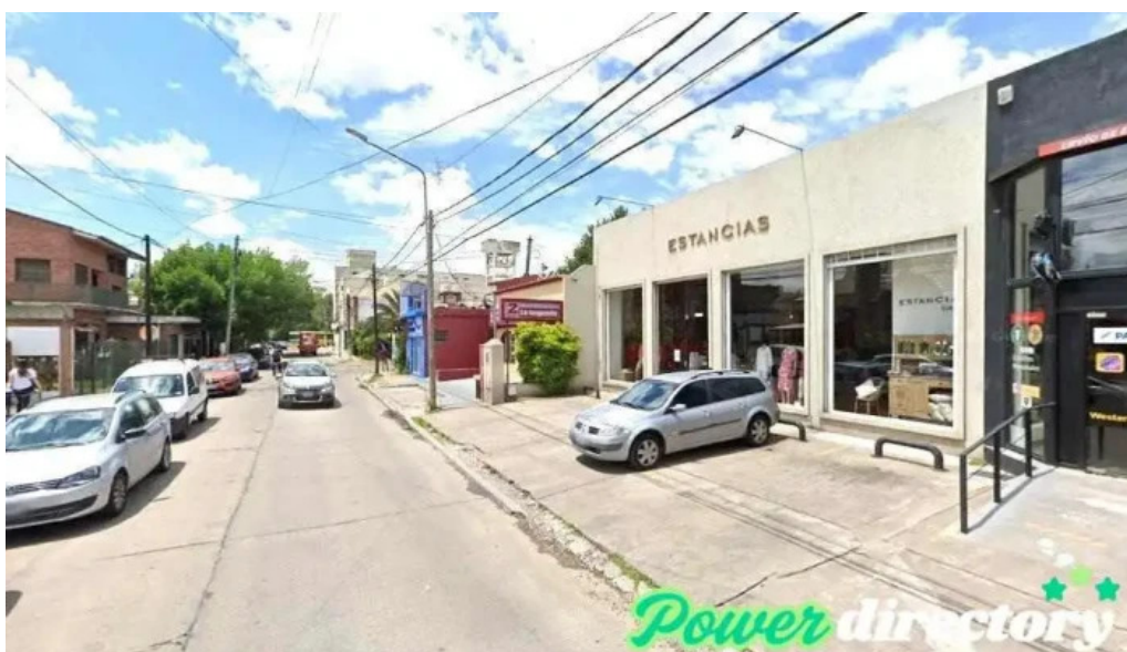
Cpe creditos bella vista