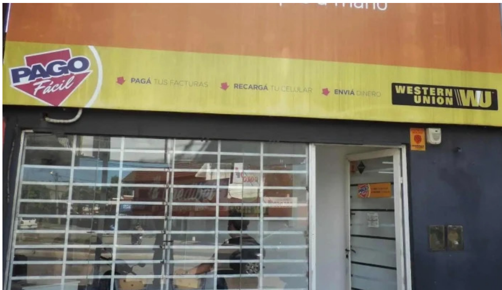
Credibel prestamos exterior