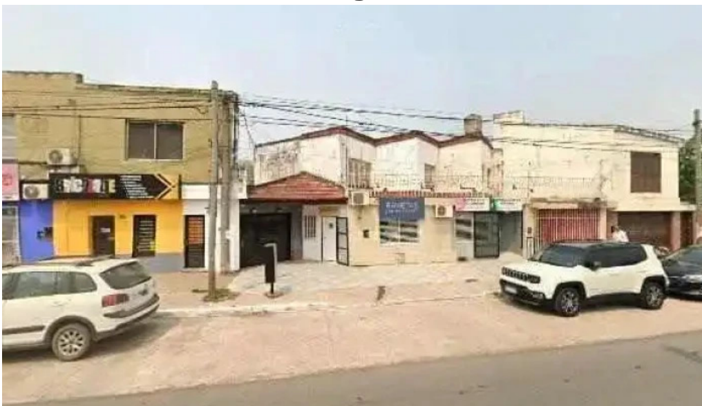
Credibel prestamos ubicacion