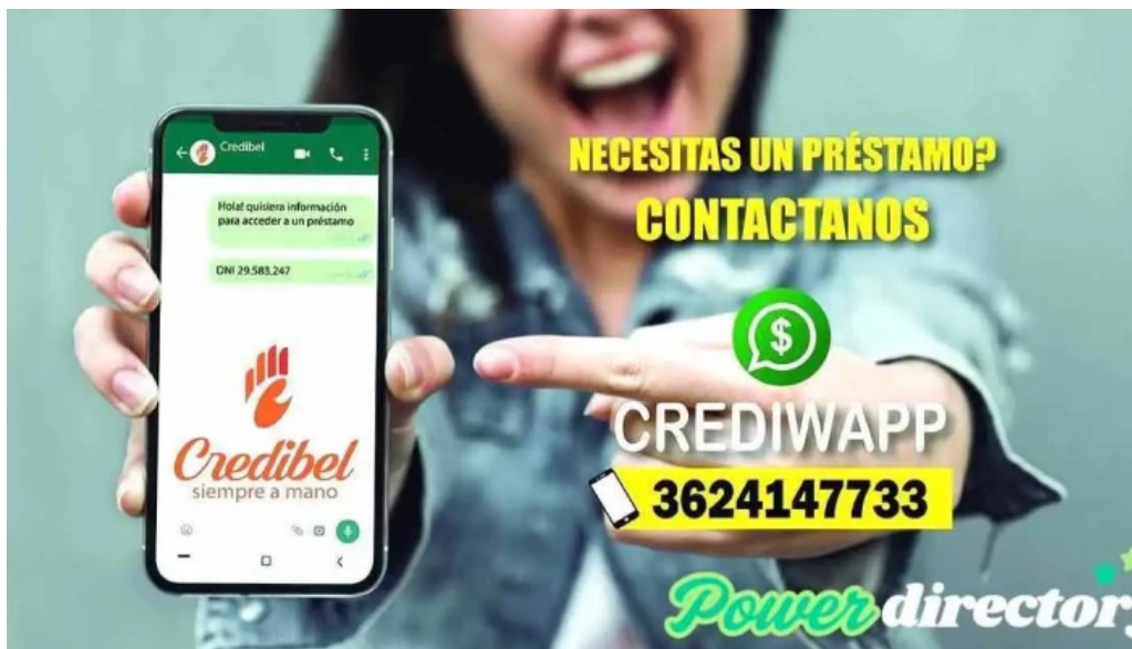
Credibel prestamos del propietario