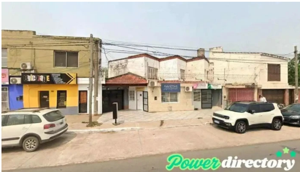
Credibel prestamos barranqueras