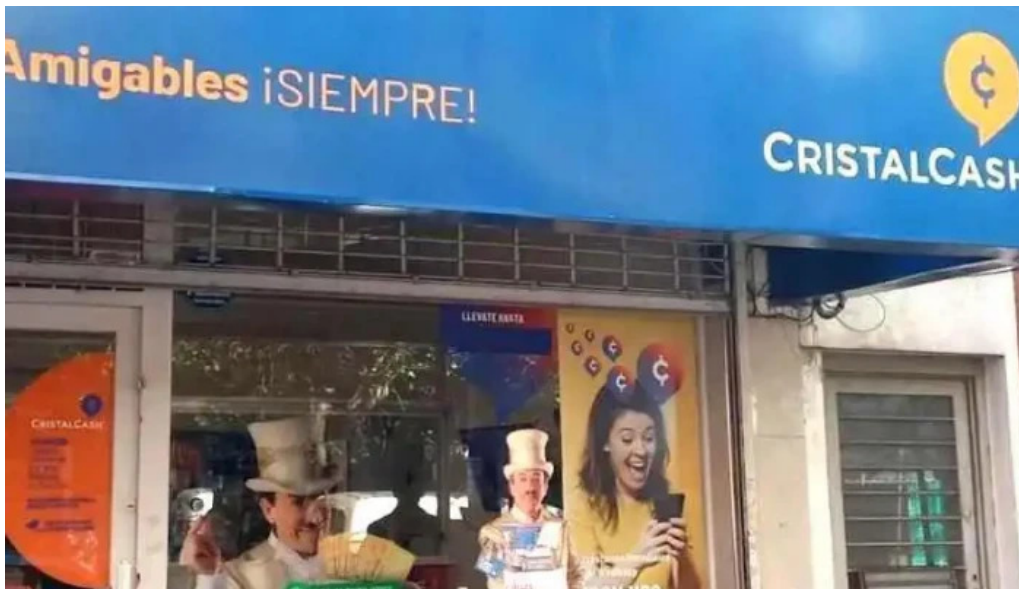
Cristal cash asf