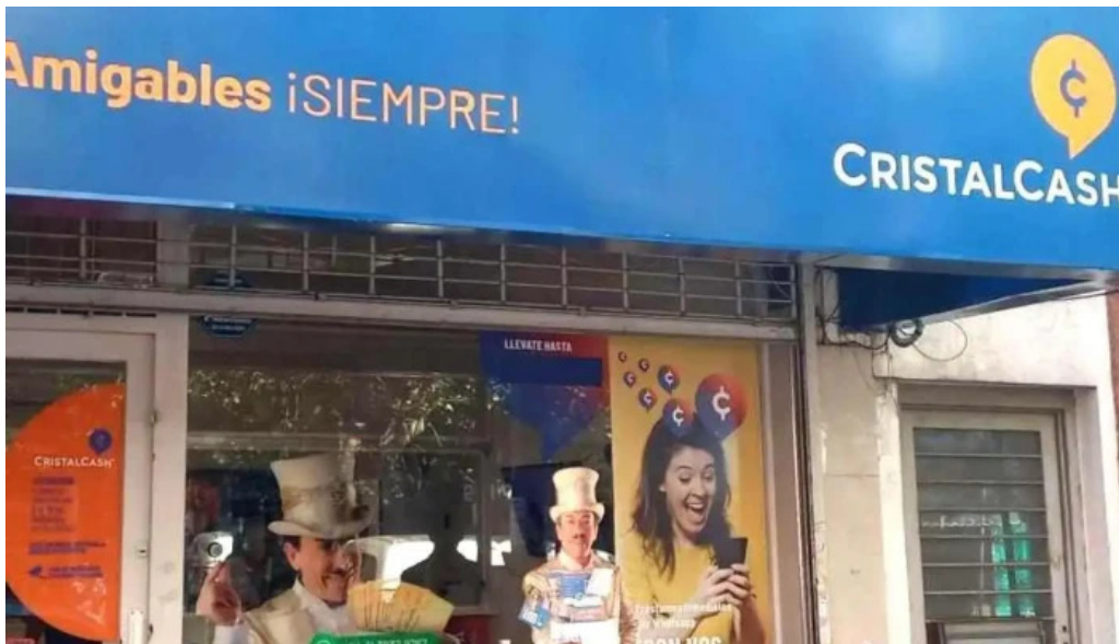
Cristal cash opiniones