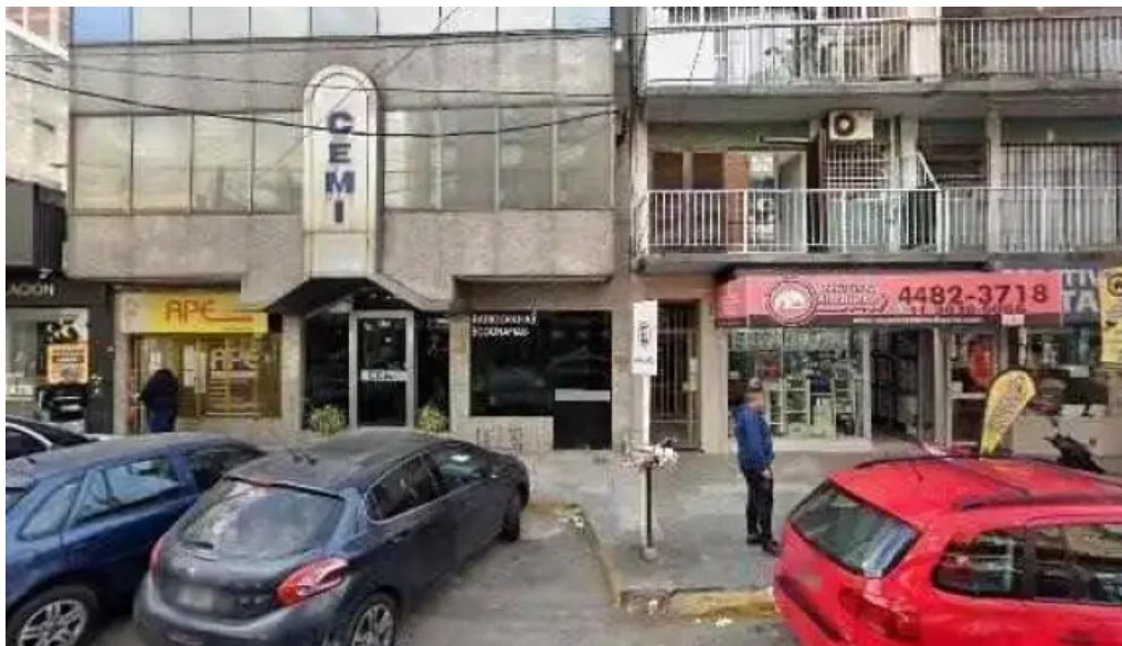
Cristal cash opinionesdeg