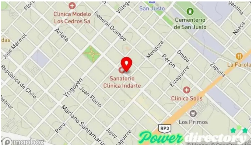
Cristal cash mapa