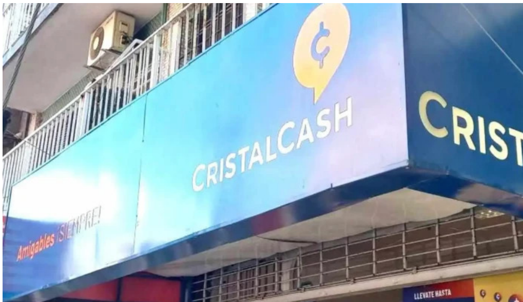
Cristal cash exterior