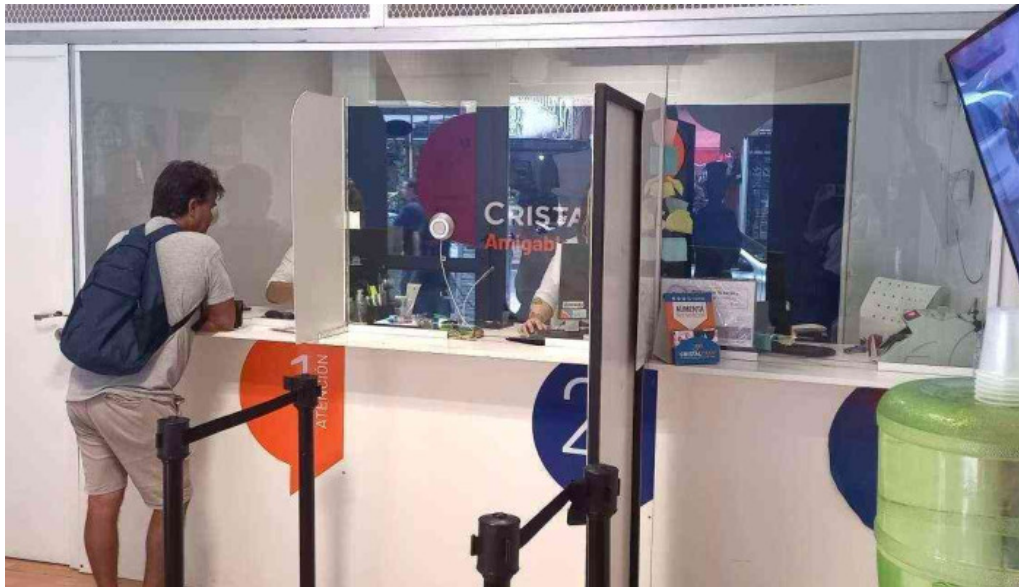
Cristal cash del propietario