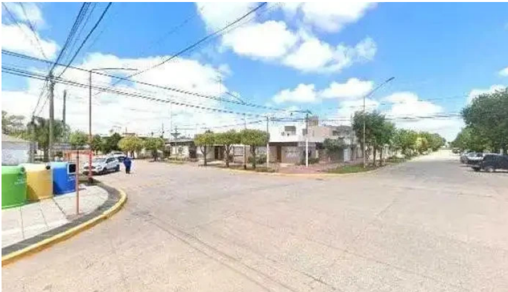
Tarjeta valor zona