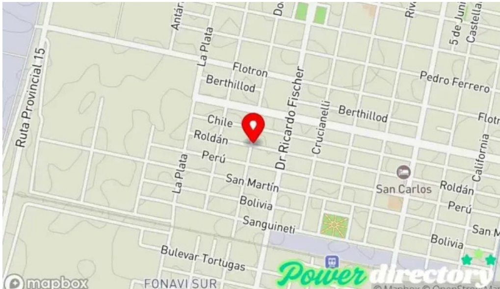
Tarjeta valor mapa