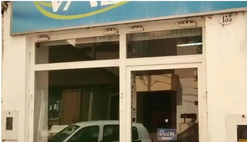
Tarjeta valor exterior