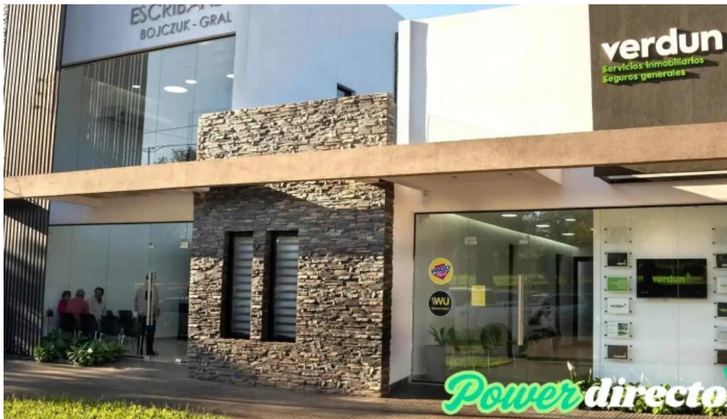
Agencia pago facil verdun seguros exterior