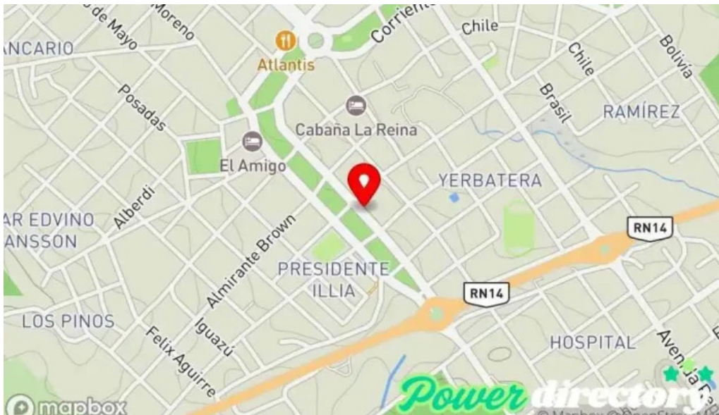
Agencia pago facil verdun seguros mapa