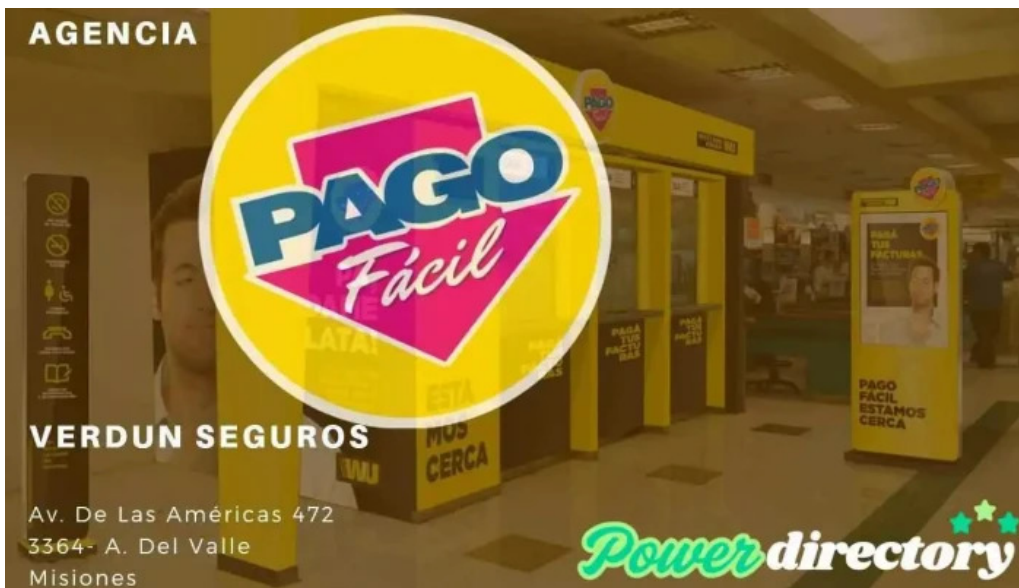
Agencia pago facil verdun seguros aristobulo del valle