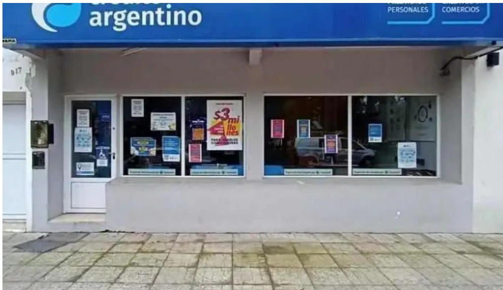
Credito argentino instagram