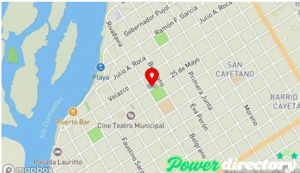
Credito argentino mapa