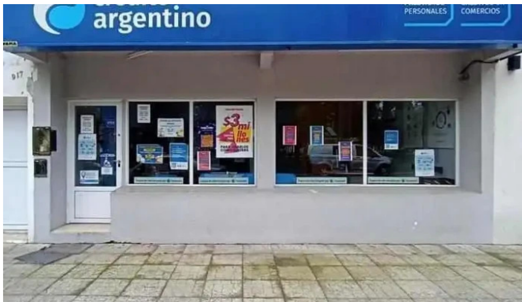
Credito argentino abj