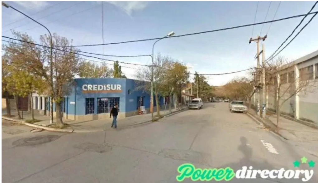
Norcred chos malal