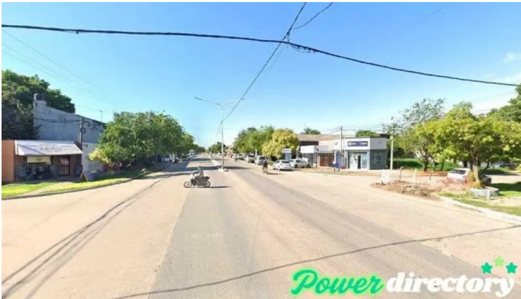
Leto monica r kinesiologa estetica corporal barranqueras