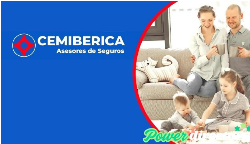
Cemiberica asesores de seguros videos