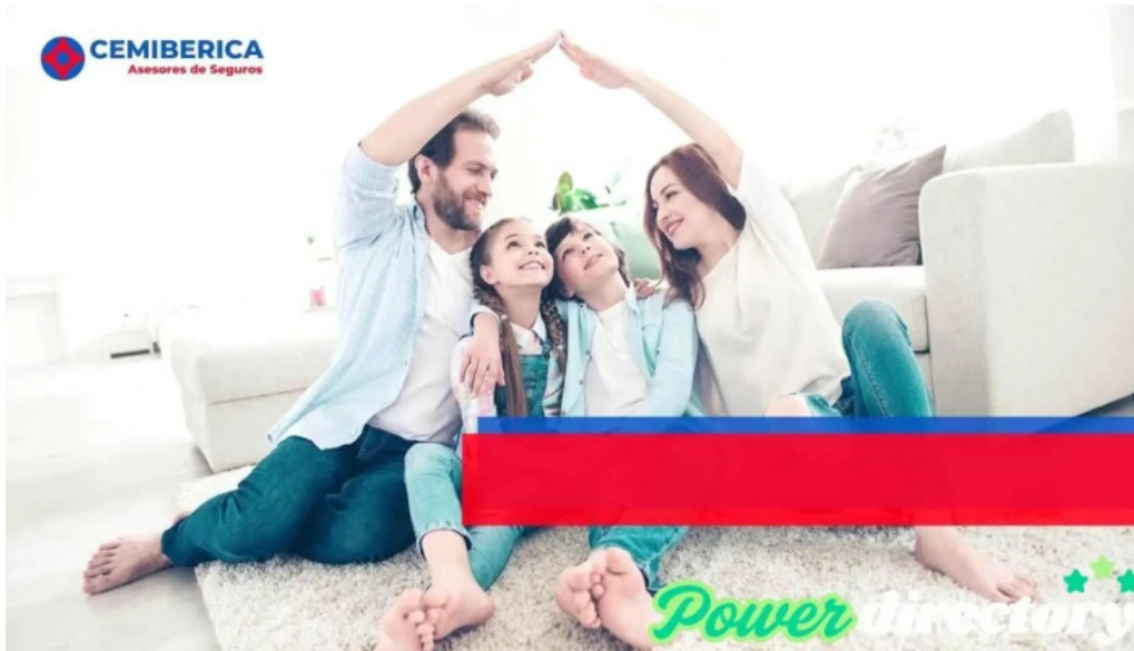
Cemiberica asesores de seguros san miguel de tucuman