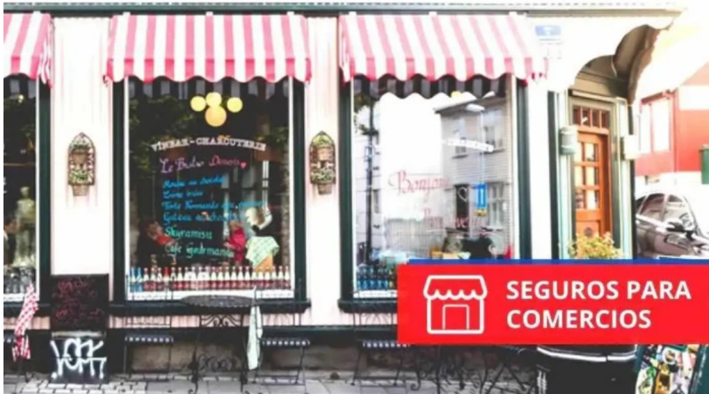
Cemiberica asesores de seguros exterior