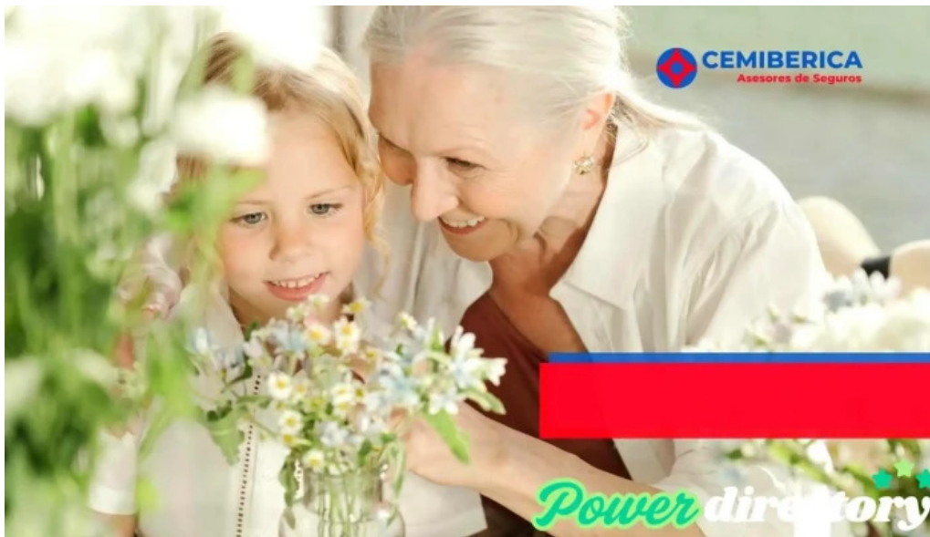
Cemiberica asesores de seguros del propietario