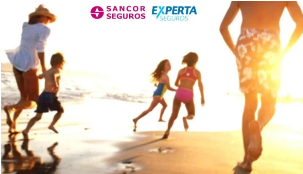
Cemiberica asesores de seguros promocion