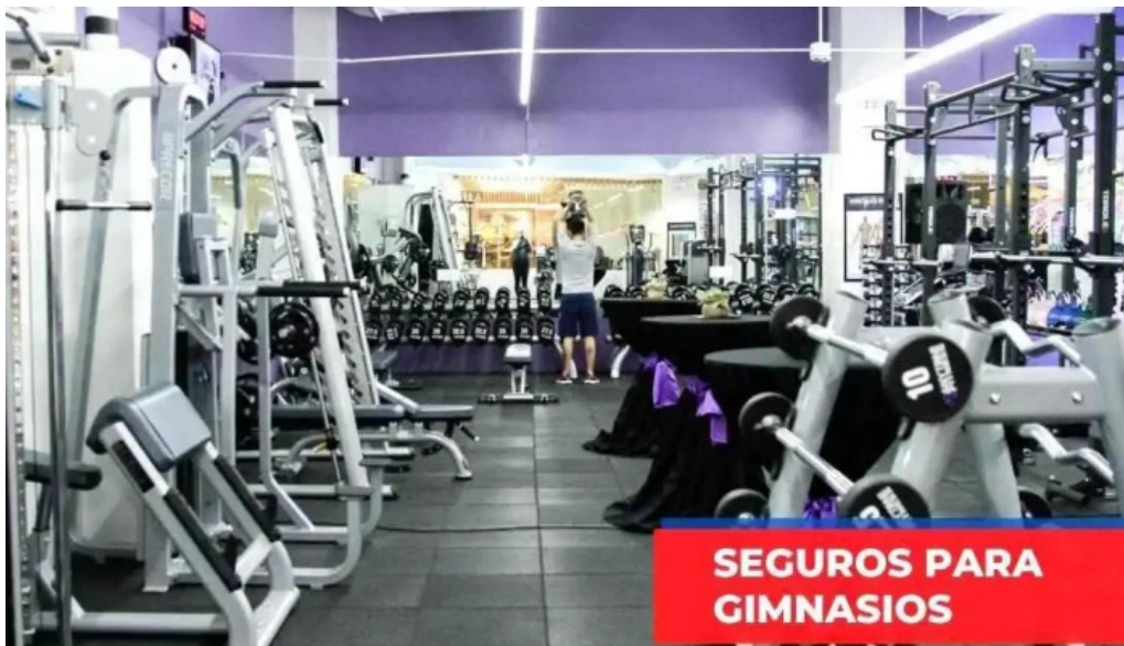
Cemiberica asesores de seguros interior