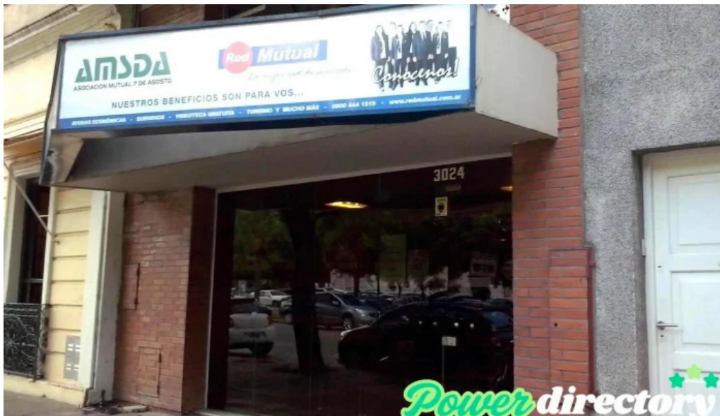
Amsda asociacion mutual santa fe de la vera cruz