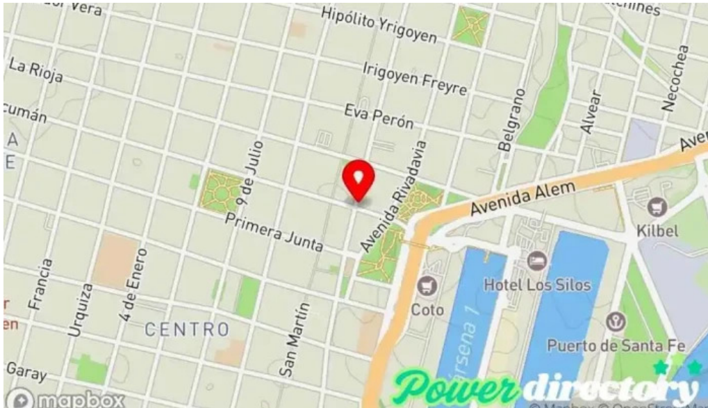
Amsda asociacion mutual mapa