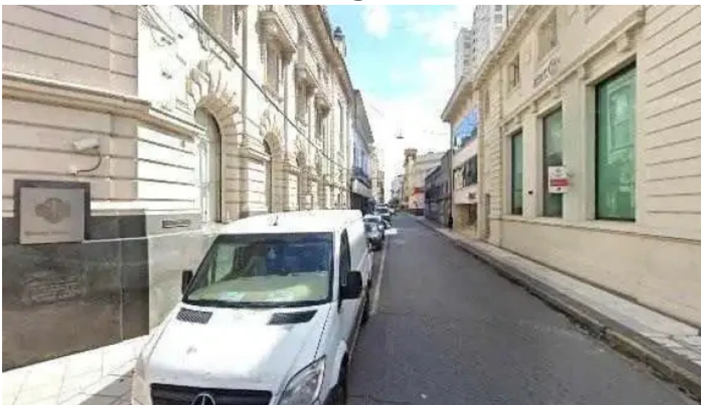
Amsda asociacion mutual sitio webdeg