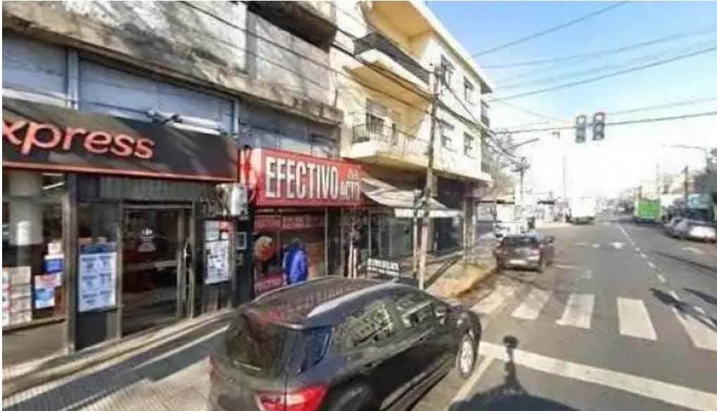
Credito velez sarsfield como llegardeg