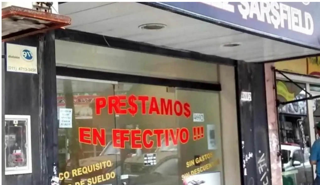
Credito velez sarsfield exterior