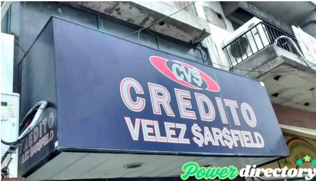
Credito velez sarsfield como llegar