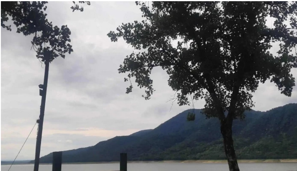
Cadicoop cerca de mi