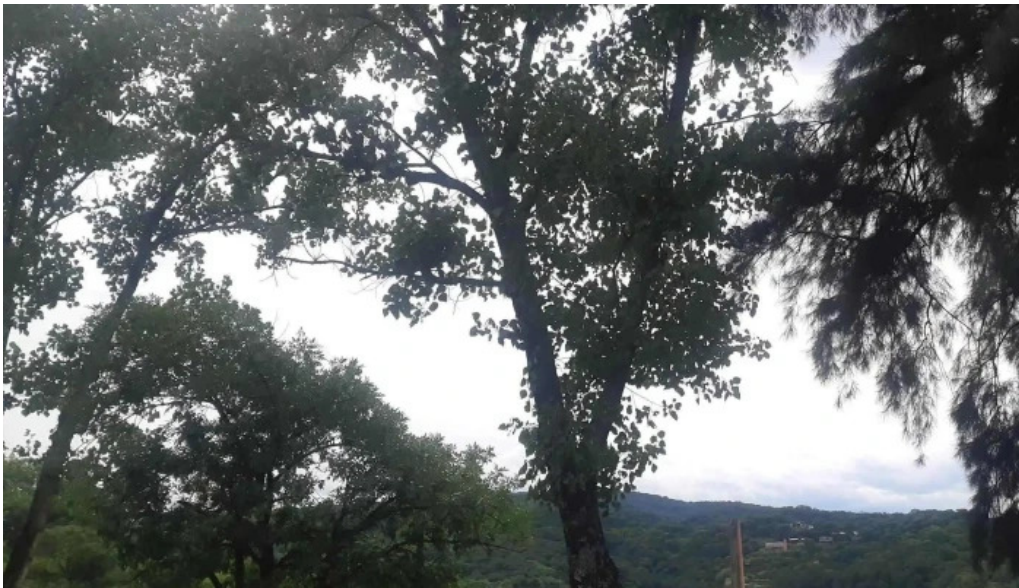
Cadicoop san miguel de tucuman