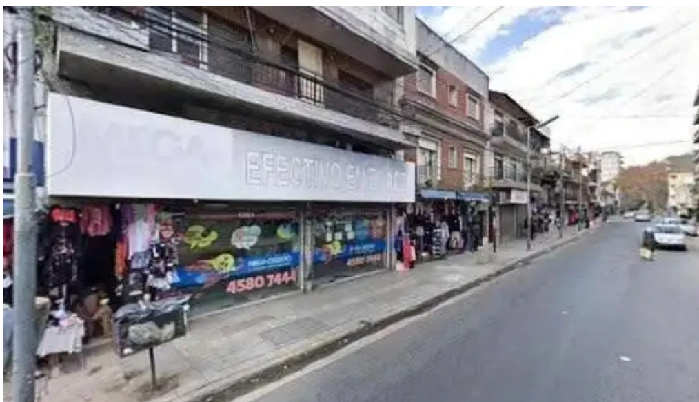
Mega credito efectivo en el acto horario