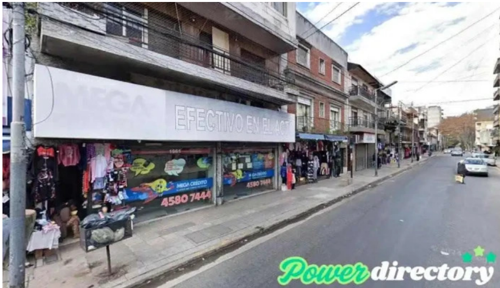
Mega credito efectivo en el acto san martin