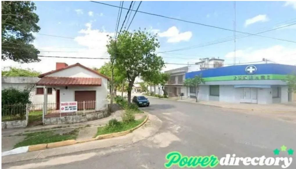
Palmares cooperativa de credito ltda san jose