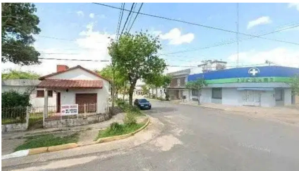
Palmares cooperativa de credito ltda opiniones