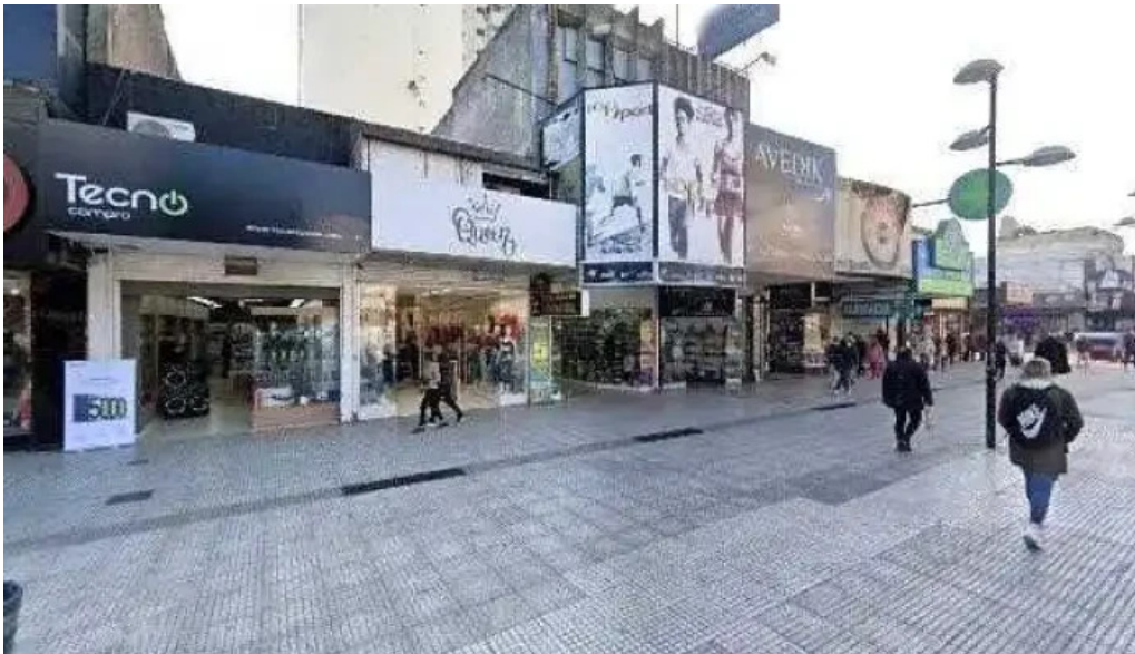
Creditos personales solo con dni telefono