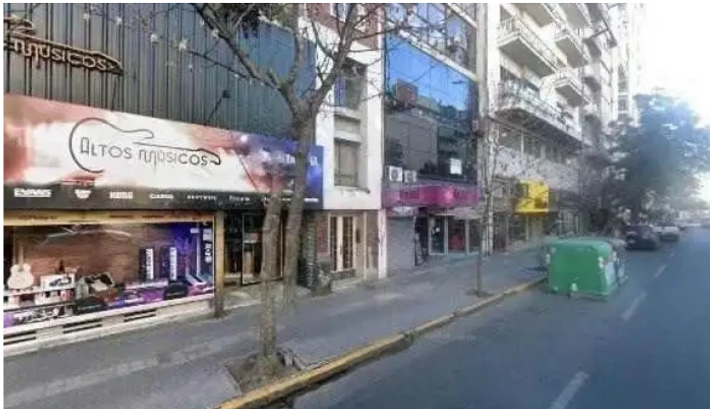
Compania social de creditos srl donde