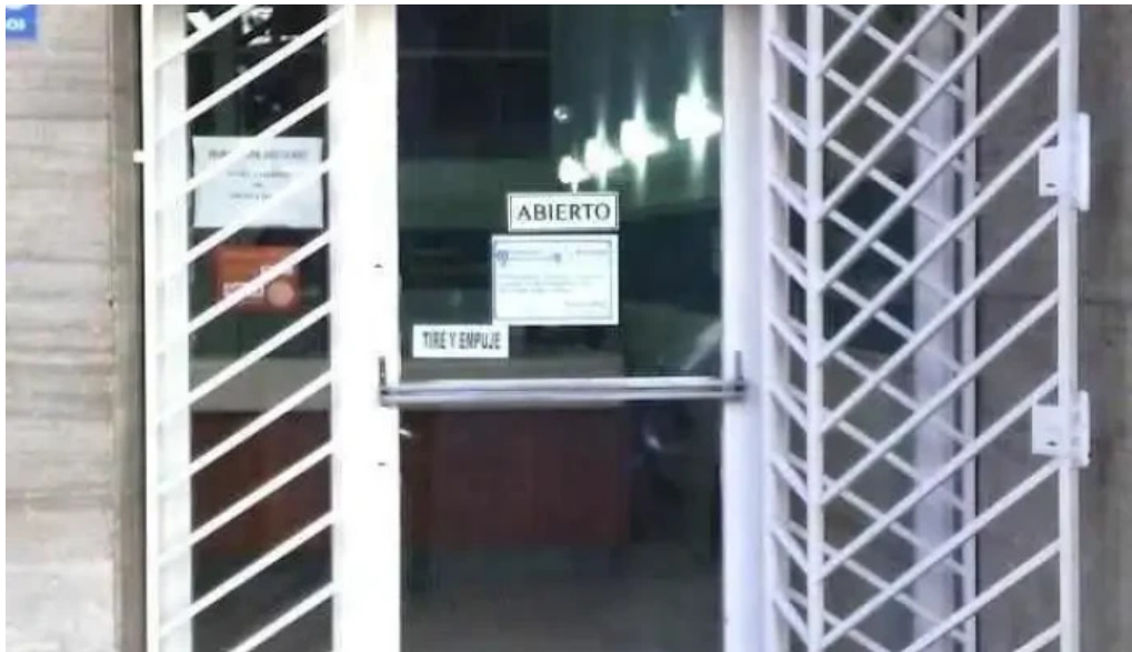
Compania social de creditos s r l eob