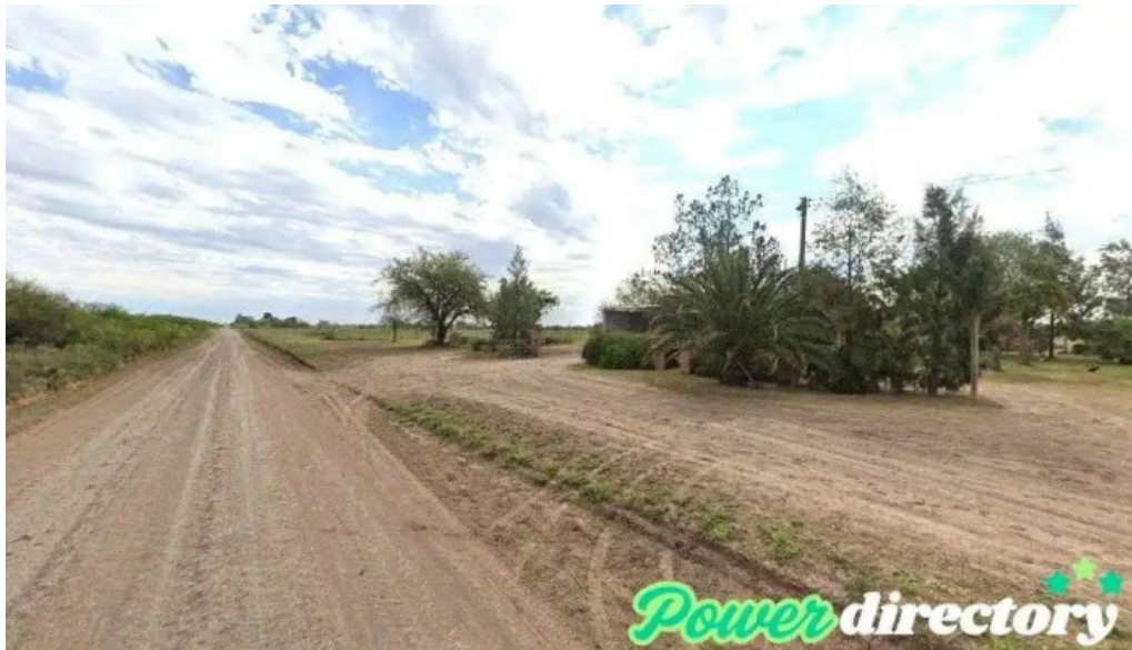
Palmares cooperativa de credito ltda entre rios