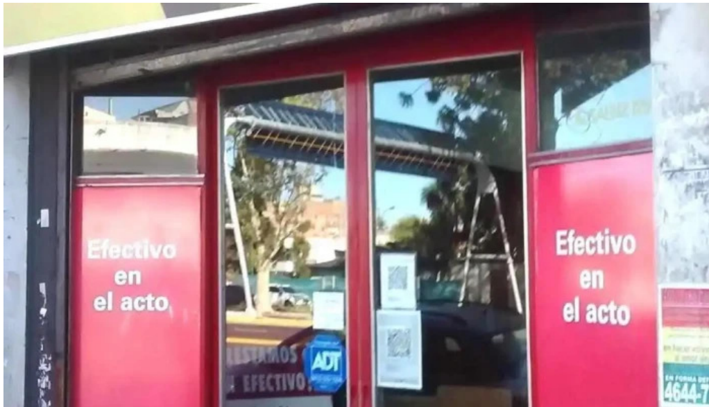
Tarjeta plata exterior