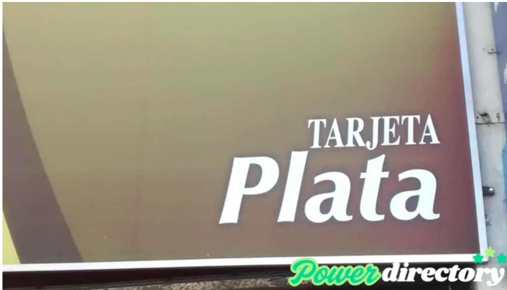
Tarjeta plata instagram