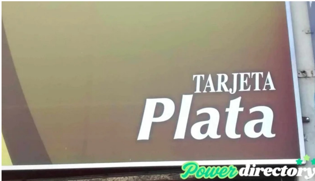
Tarjeta plata doe