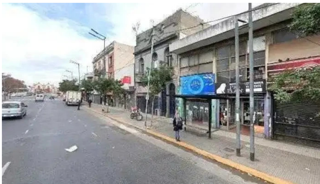
Tarjeta plata instagramdeg